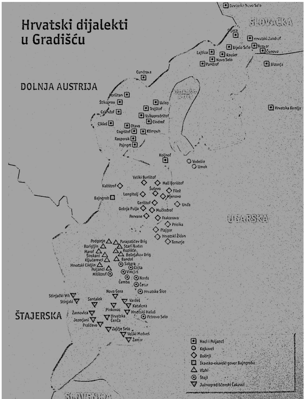
Slika 3: Prikaz rasprostranjenosti hrvatskih dijalekata u Gradišću (Karall 1998: 172)