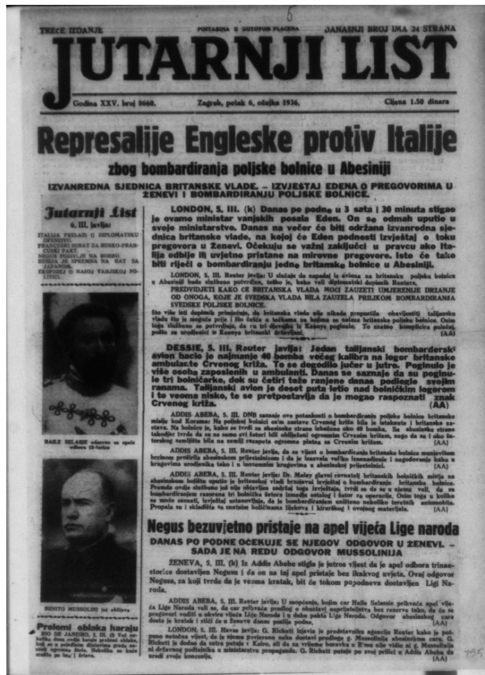
Fotografija 7.) Naslovna stranica Jutarnjeg lista od 6. III. 1936. godine, sa fotografijama vođe sukobljenih strana u ratu.