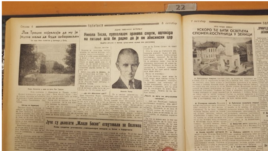
Fotografija 1.) Članak iz Politike – intervju s Nikolom Teslom