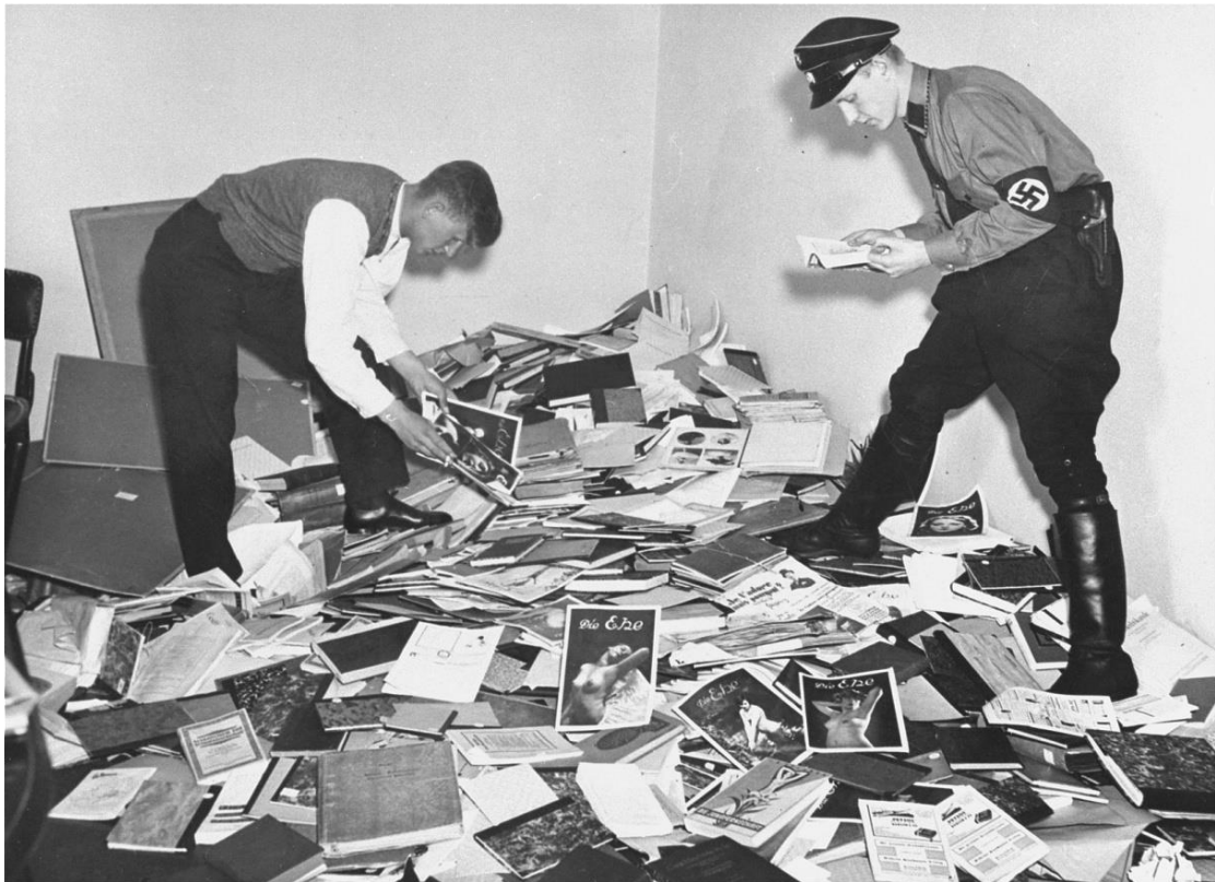
Slika 1. Njemački studenti i paravojna organizacija SA pljačkaju knjižnicu Instituta za seksualne nauke u Berlinu

pružala bračno savjetovanje. Tokom tri sata studenti su proljevali tintu na tepihe, razbijali ili uništavali uokvirene slike, staklo, porculan, mramorne posude, svjetla i ukrase. Uzimali su sa sobom knjige, časopise, fotografije, anatomske modele, pa čak i skulpturu Hirschfeldove glave. Nakon studenata, u 15h došli su SA-ovci te zaplijenili 10000 knjiga iz knjižnice Instituta. Nekoliko dana kasnije, skulptura Hirschfeldove glave se nosila na stupu kroz paradu s bakljama, prije negoli su je bacili na lomaču zajedno s knjigama iz Instituta. 32