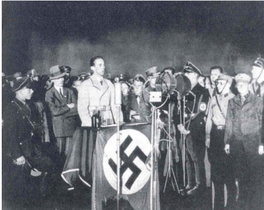
Slika 4. Joseph Goebbels drži govor prilikom spaljivanja knjiga na Opernplatzu u Berlinu

Dominantna tema u Goebbelsovom govoru je bila brisanje povijesti, a također je bila bitna i ideja radikalne čistoće, religijske čistoće i kulturne čistoće koja je provedena kroz simboliku čišćenja, gdje je knjiga ujedno i nositelj i simbol zaraze. Goebbels je uz spominjanje brisanja povijesti, govorio i o židovskim "asfalt-književnicima" te njihovom smeću i prljavštini koja puni knjižnice, a upravo su smeće i prljavština ono što uzrokuje bolesti. 54