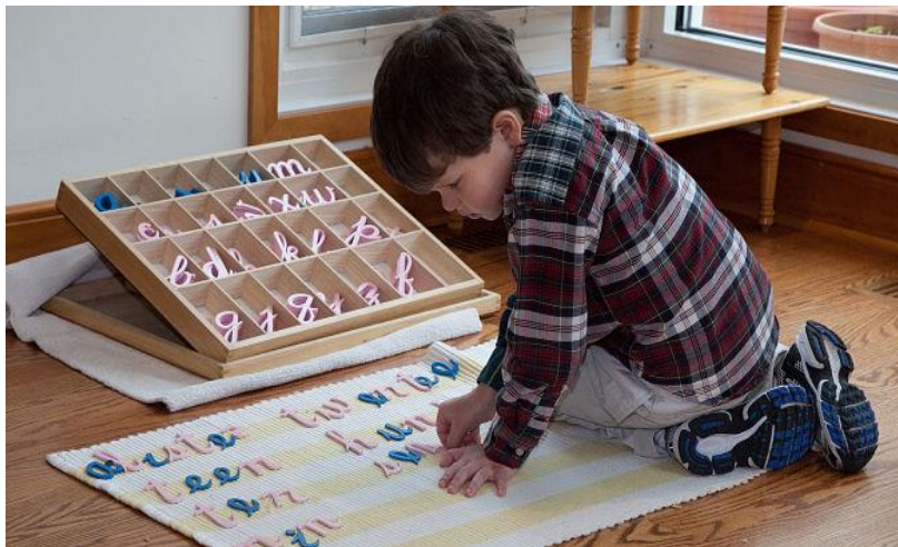
Slika 5.: Dječak koristi pokretnu abecedu ( https://forestbluffschool.org/the-montessori-approach-to-reading-and-writing/ ).

Pokretna abeceda služi za sastavljanje riječi od pojedinačnih slova koja su izrezana iz ružičastog i plavog kartona te odijeljena u posebne pretince unutar kutije pokretne abecede. Budući da prethodne vježbe za poticanje fonološke osjetljivosti i čitanja omogućuju djetetu da već poprilično raspoznaje glasove i njihove simbole – slova, u ovoj je vježbi, kako ističe Montessori, dovoljno polako i pravilno izgovoriti riječ kako bi dijete moglo prepoznati koje bi komponente, odnosno slova, trebalo koristiti iz pokretne abecede. Dijete promatra i traži odgovarajuće slovo unutar kutije pokretne abecede za glasove koje čuje te slova slaže jedno do drugoga pritom slažući čitavu riječ. S vremenom će dijete samo moći složiti bilo koju riječ koje se dosjeti. Kada dijete na ovaj način složiti riječ, ono je već može i pročitati. Prema tome, ovakva metoda uključuje procese koje dijete vode prema pisanju, ali istovremeno i prema