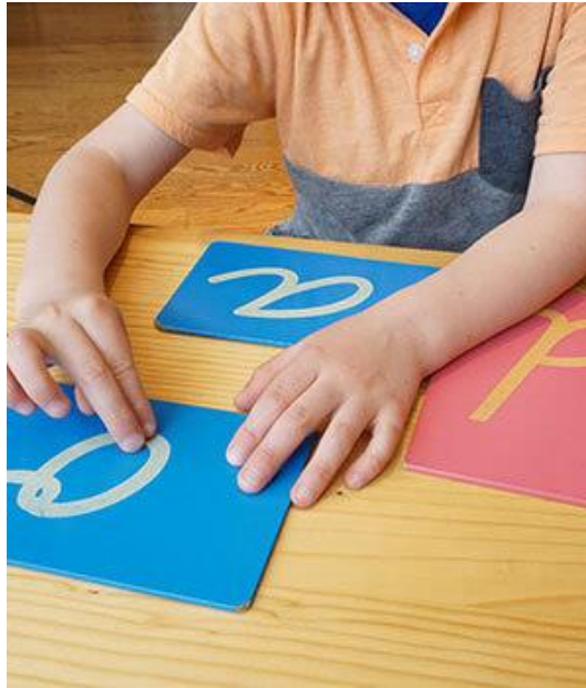
Slika 4. Vježbanje na slovima od brusnog papira ( https://forestbluffschool.org/wp-content/uploads/2017/05/sandpaper-letters_montessori-approach-to-reading-and-writing.jpg ).

Slova od brusnog papira vjerojatno su najpoznatiji Montessori didaktički materijal za jezik. Slova jezika u kojem dijete odrasta izrezana su u grubom, hrapavom papiru i zalijepljena na drvene pločice. Samoglasnici su obojani plavom, a suglasnici crvenom bojom (Seitz i Halwachs, 1997). Odgojitelj pokazuje djetetu kako pokretom pravilno slijediti obris određenog slova na brusnom papiru, a zatim dijete imitira pokret koji pokazuje odgojitelj. Odgojitelj izgovara glas koji odgovara slovu kojeg dodiruje vršcima prstiju, a isto čini i dijete kada polako i točno slijedi obris određenog slova (Montessori, 1965). Primjerice, dijete slijedi pokret za pisanje slova m i n vršcima prstiju te istovremeno kako slijedi obris određenog slova izgovara i glasove /m/ i /n/. Nakon toga, odgojitelj će reći djetetu: „Daj mi m !“. A zatim: „Daj mi n !“ I tada dijete daje odgojitelju slovo koje ga on traži. Na kraju, odgajatelj postavlja pitanje djetetu pokazujući na određeno slovo, primjerice slovo o : „Što je ovo?“, na što dijete odgovara: „To je o !“ (Montessori, 1965). Tako se postupno uvode i drugi glasovi i pripadajuća slova. Iz navedenog se uočava uključivanje vizualne, auditivne i taktilne percepcije u usvajanju određenih glasova