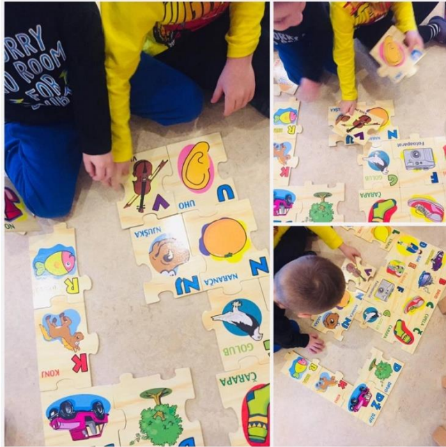
Slika 2.: Djeca slažu abecedne slagalice

samo prepoznaje glasove u svakodnevnim riječima ili da ih pokuša supstituirati drugima. Također, isticanjem početnog glasa i uočavanjem grafema, stvara se veza slovo – glas.