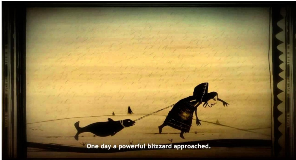
Slika 5 Skrimshaw cutscene (Never Alone 2014)

uporabnu ulogu unutar zajednice. Pričanje priče i potreba da ljudi surađuju s prirodom je u srži igre i želja je prenijeti i naučiti ljude živjeti u suradnji s prirodom.