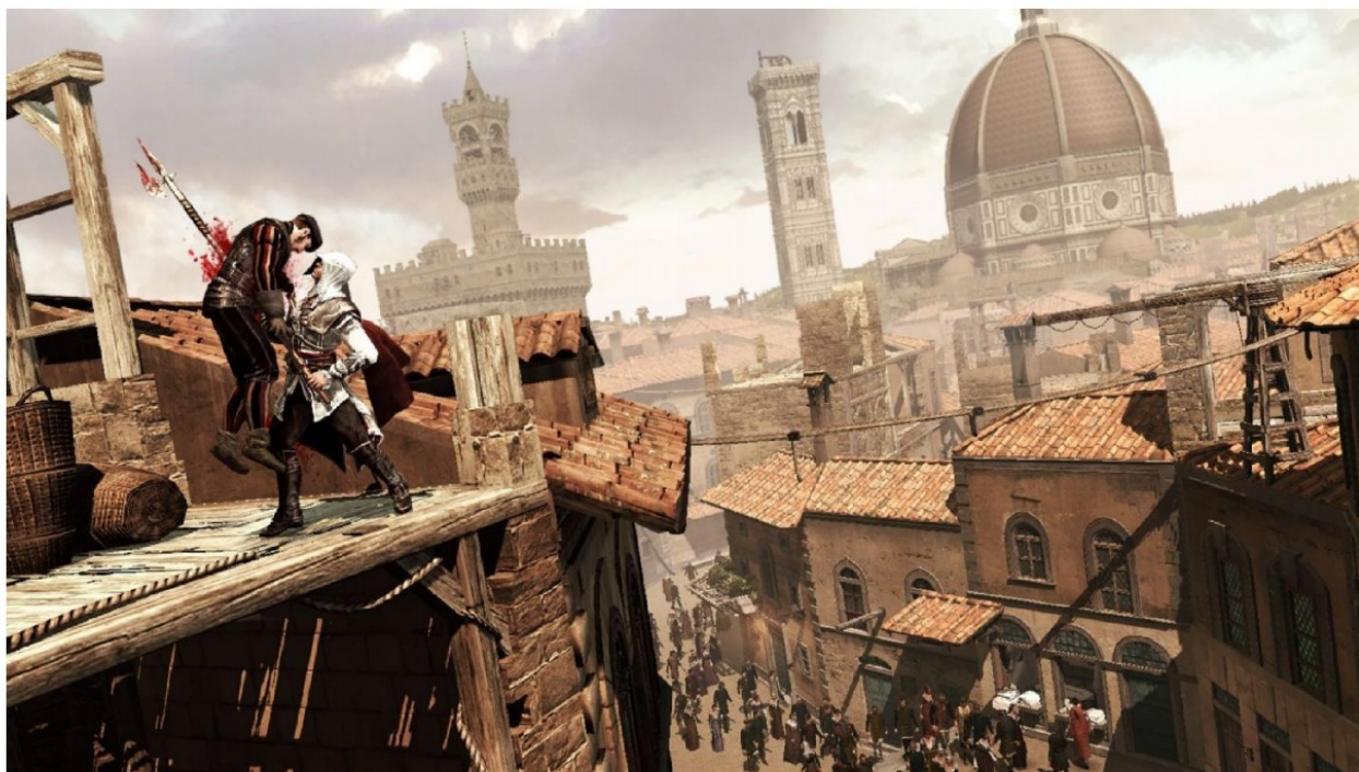
Slika 1 Assassin's Creed II. Preuzeto s https://www.newgamenetwork.com/media/1263/assassins-creed-2/ 7.2.2021.

Oni prikazuju određenu interpretaciju povijesti stavljenju u jasno razrađen povijesni kontekst. Prikazano istraživanje ne pokazuje nam samo elemente koji su zajednički aplikacijama razvijenim u svrhu baštine i zabavnim računalnim igrama nego nam ističe kako računalne igre mogu uključiti potrebne elemente za prenošenje znanja koje muzejski stručnjaci prepoznaju kao bitno. Mortana i suradnici naglašavaju kako je potrebno očuvati baštinu te smatra da je materijalna baština našla načine u očuvanju i prezentaciji dok je nematerijalna baština koja uključuje „društvene vrijednosti i tradiciju, običaje i prakse, filozofske vrijednosti i vjerovanja, umjetničke ekspresije, jezik i folklor” (Mortana et al 2015:13) teža za prenijeti u cijelom njenom kontekstu te da računalne igre radi svoje mehanike i moguće multimodalnosti mogu doprinijeti u njenoj komunikaciji na van. Tako bi oblikovane igre u službi baštine potom mogle biti korištene i u formalnom i neformalnom kontekstu i kao grupne ili individualne igre. Na primjer, igra Never Alone uz to što je dostupna za igranje sa svojih privatnih konzola ona je također bila dio izložbe Stampede: Animals in Art koja je bila smještena u Umjetničkom muzeju u Denveru, SAD, od 10. studenog 2017. do 19. svibnja 2019. godine koja je obrađivala temu odnosa ljudi i životinja 5 te je bila prezentirana i mogla se igrati za vrijeme Dana domorodačkog stanovništva u Heard muzeju u Phoenixu. Također,