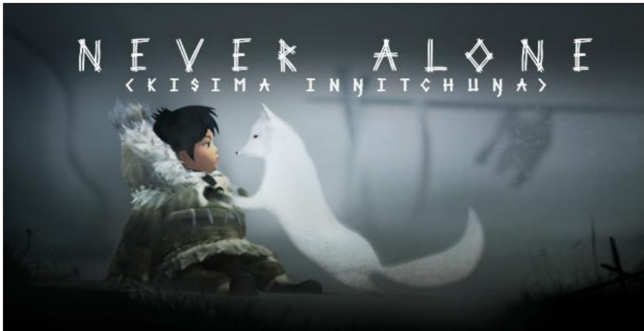
Slika 2 Nuna i arktička lisica (Never Alone 2014)