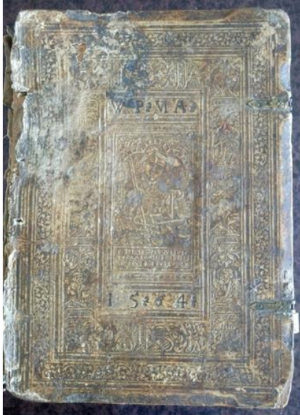
Slika 1. Prednje korice primjerka Biblia cum interpretationibus hebraicorum nominum (1487.) Gradske knjižnice, sign. R-5801.