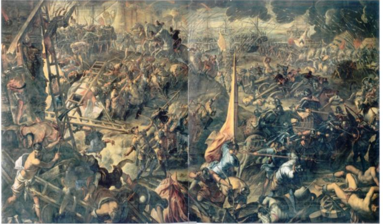
Tintoretto, Vittoria dell'esercito veneziano contro gli Ungheresi per la conquista di Zara 1346.

tradicije kroz prikaz natprirodnih događaja, a upravo su rezultati istraživanja i nova pitanja koja su se otvorila bila poticaj da istraživanje ovog izuzetno zanimljivog i zagonetnog teksta nastavim i u ovoj doktorskoj disertaciji.