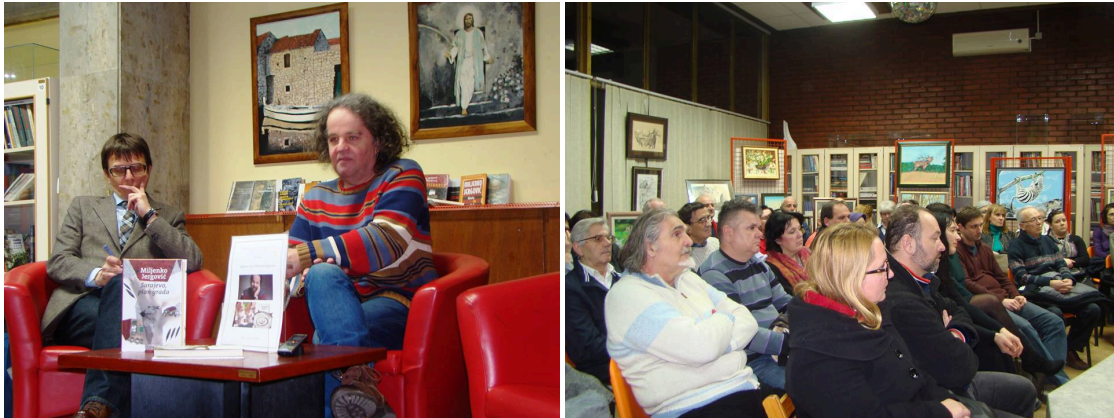
Slika 36. i 37. Književni susret s Miljenkom Jergovićem

U siječnju 2016. godine organizirana je književna večer s Miljenkom Jergovićem na kojoj je književnik predstavio svoja posljednja djela Sarajevo, plan grada i Doboši noći .