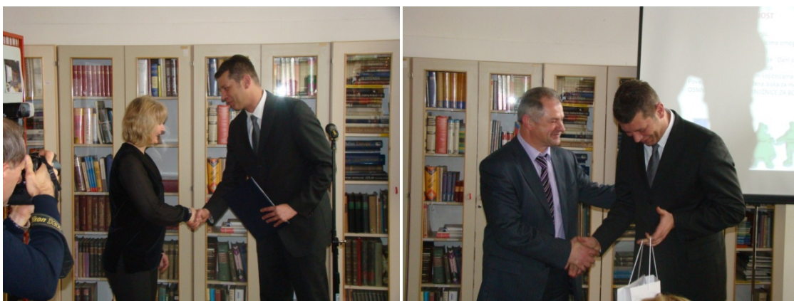
Slika 1. i 2. Pismo potpore Ministarstva kulture RH. (Iz arhiva Ogranka Caprag)

Pismo potpore Ministarstva kulture Republike Hrvatske, na prijedlog Hrvatskoga knjižničnog vijeća o prihvaćanju inicijative za osnivanjem Središnje knjižnice nacionalne manjine Bošnjaka pri Narodnoj knjižnici i čitaonici Sisak, potkrijepljenu izjavama potpore relevantnih bošnjačkih udruga i pojedinaca, uručio je još u prosincu 2011. godine ministar kulture Republike Hrvatske Jasen Mesić tadašnjoj ravnateljici Narodne knjižnice i čitaonice Vlado Gotovac Sisak Snježani Pokorny.