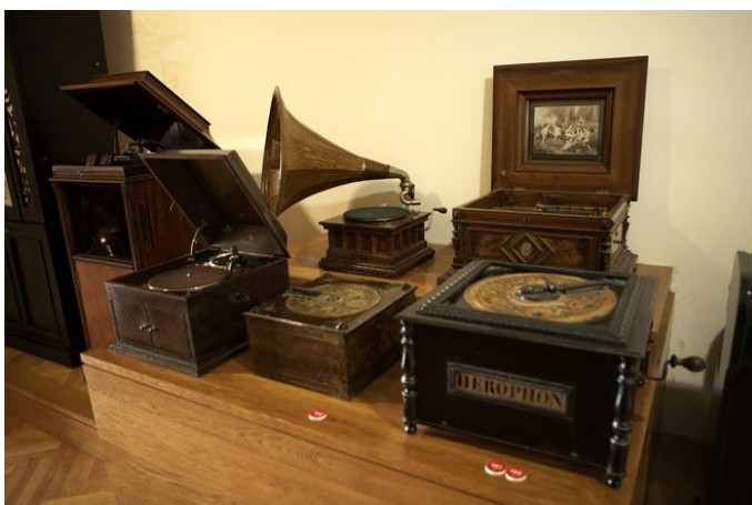
Slika 3 6