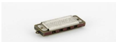
Slika 4 7