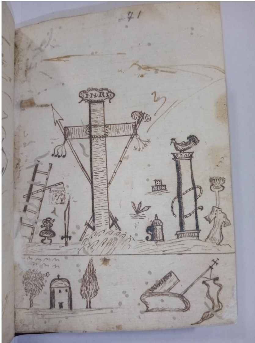
Slika 5. Crtež sa simbolima muke Isusove.