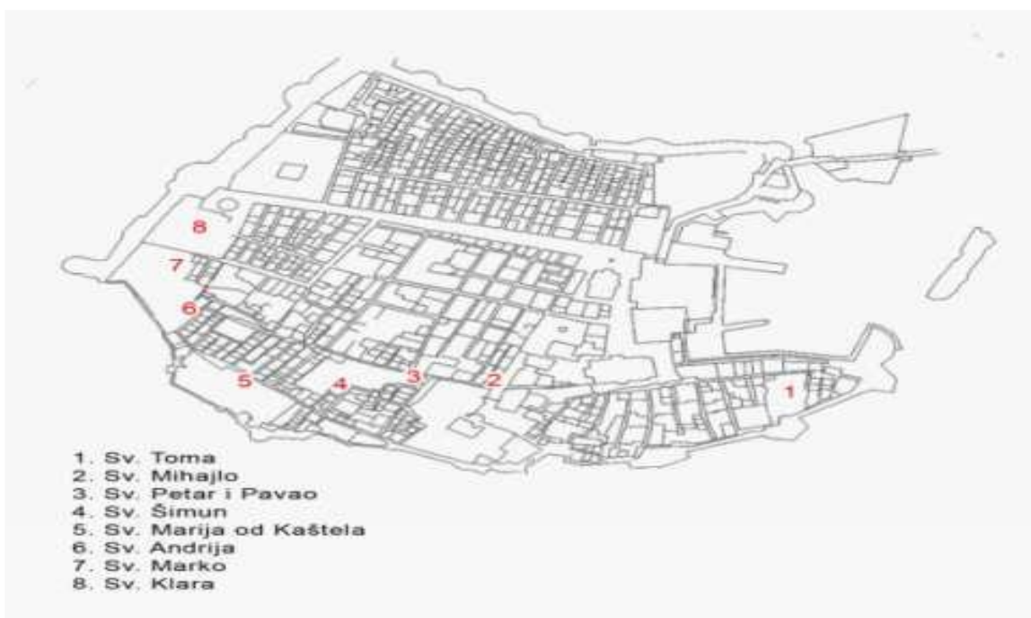
Slika 1. Položaj ženskih samostana prije potresa 1667. godine.