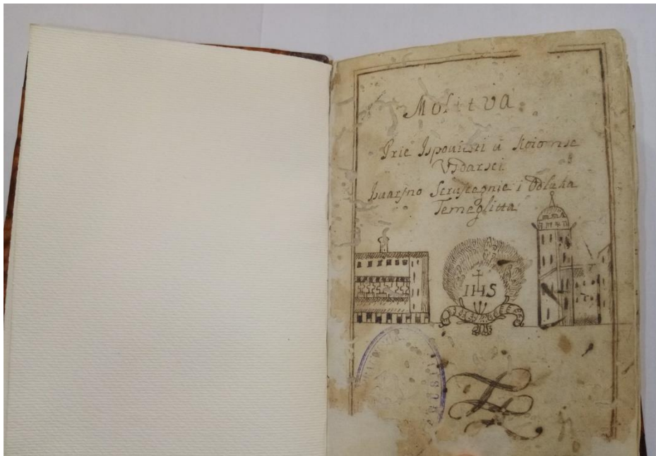
Slika 6. Crtež benediktinskog samostana, crkve i Isusova monograma (IHS).