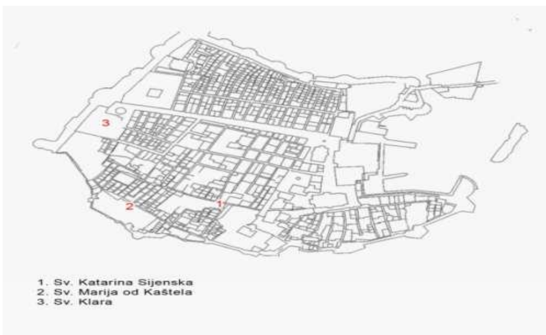
Slika 2. Položaj ženskih samostana tijekom 18. stoljeća.