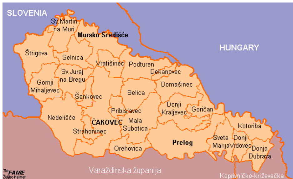
Karta 2. Položaj Općine Vratišinec na geografskoj karti Međimurja.