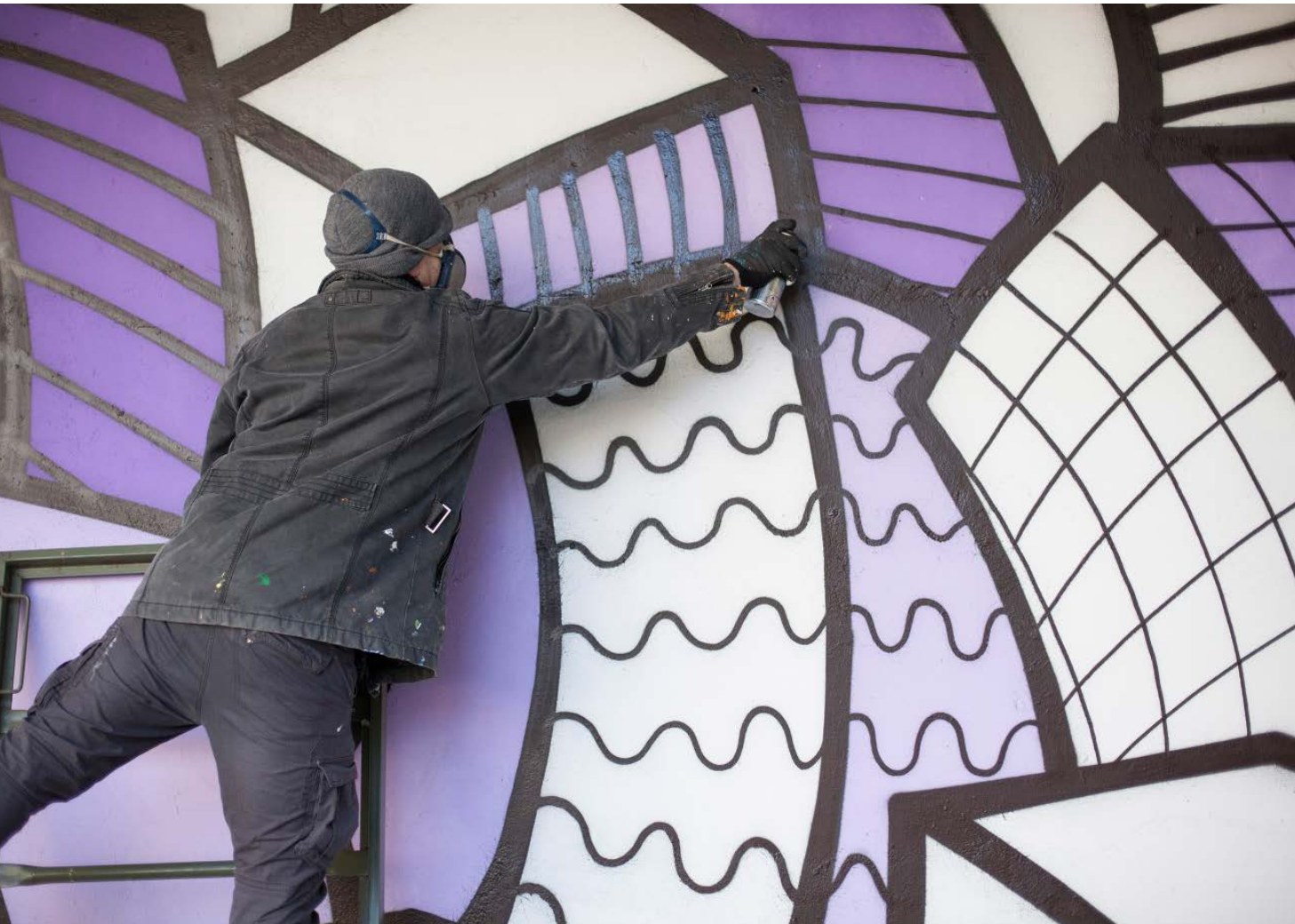
Oslikavanje dvorišnog zatvorskog zida / The painting of the wall in the prison yard (Slaven Lunar Kosanović, Heroji [Heroes], 2019.).