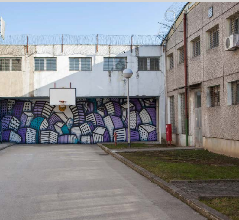
Slaven Lunar Kosanović, Heroci [Heroes], 2019.