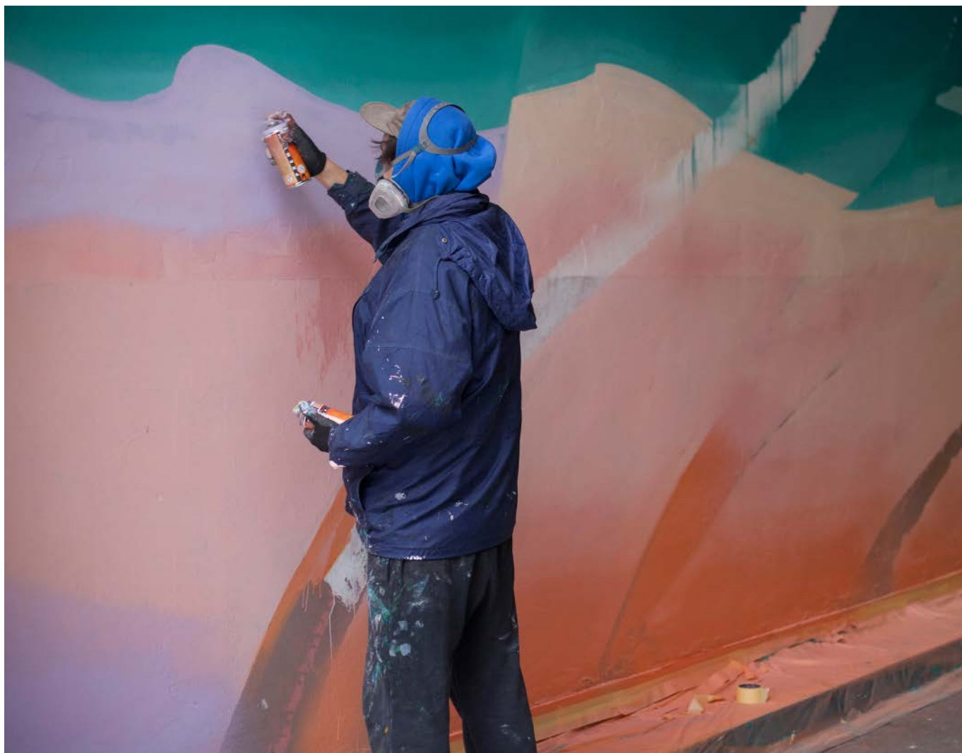
Oslikavanje ulaznog zatvorskog zida / The painting of the prison's entrance wall (G. Rakić).