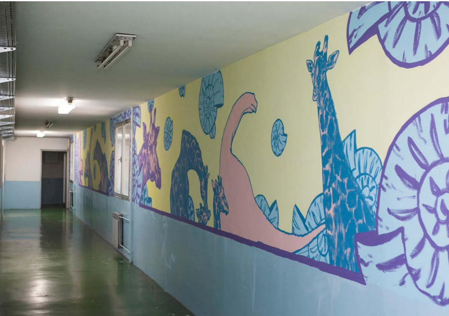
Ivan Oštarčević Zgubljen, Adaptacija [Adaptation], 2019.