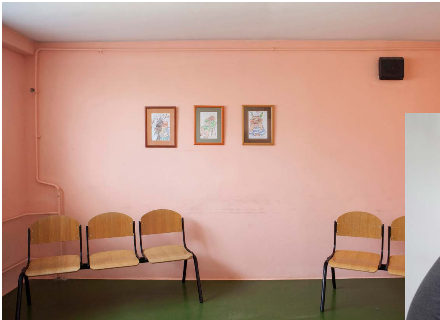
Soba za terapijske aktivnosti prije umjetničkih intervencija / The room for the therapeutic activities before the art intervention.