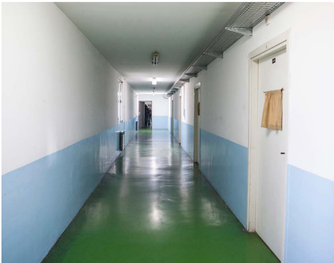
Hodnik prije umjetničke intervencije / The hall before the art intervention.