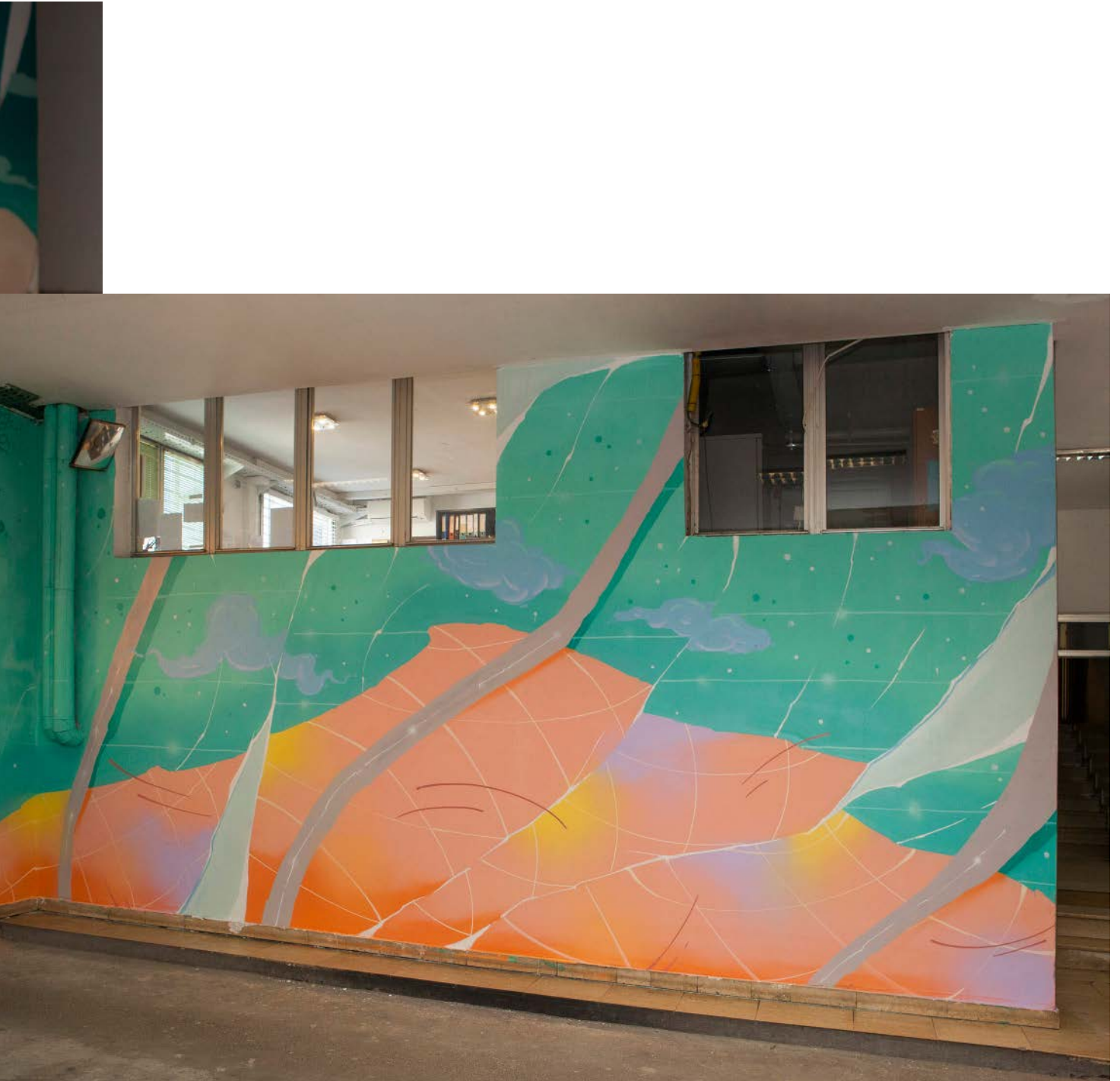
Goran Rakić, Refleksija slobode [Reflexion of Liberty], 2019.