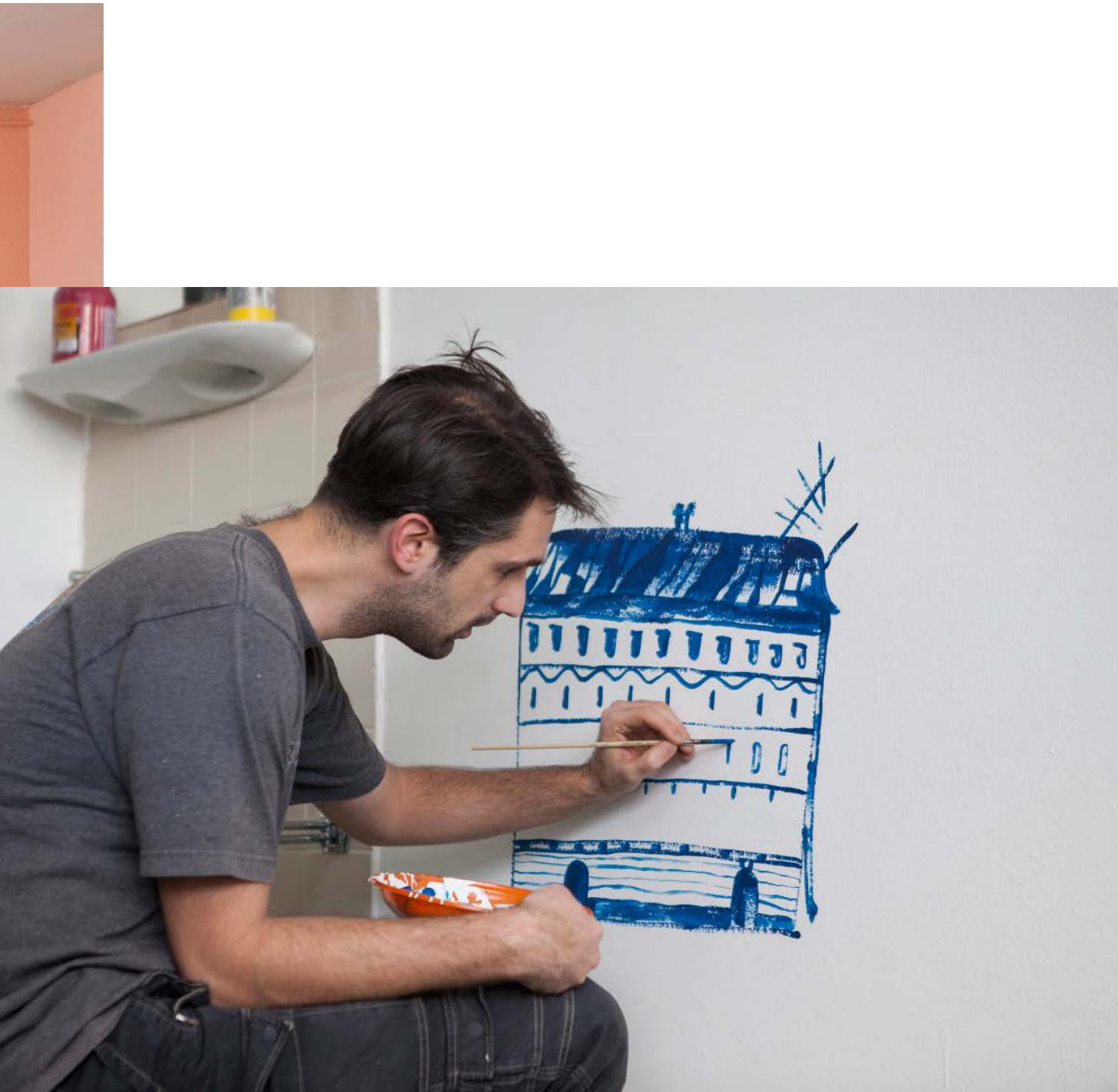
Oslikavanje terapijske sobe / The painting of the therapy room (Dominik Vuković, Pogled u bolje sutra [The View in the Better Tomorrow], 2019).