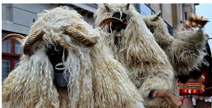
Slika 12. Đakovački bušari