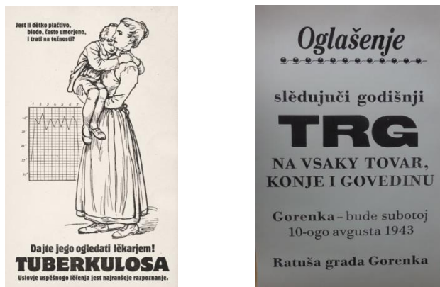
Slika 2 i 3: plakati na međuslavenskom iz filma Obojena ptica

U filmu možemo vidjeti i plakate koji su pisani međuslavenskim. 159