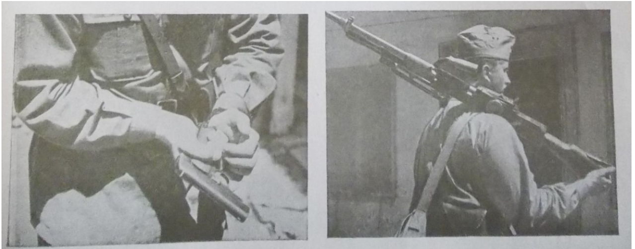
Slika 6 „Ustaške vježbe“, Ustaška mladež: omladinski prilog „Ustaše“ , 7. rujna 1941., 15.