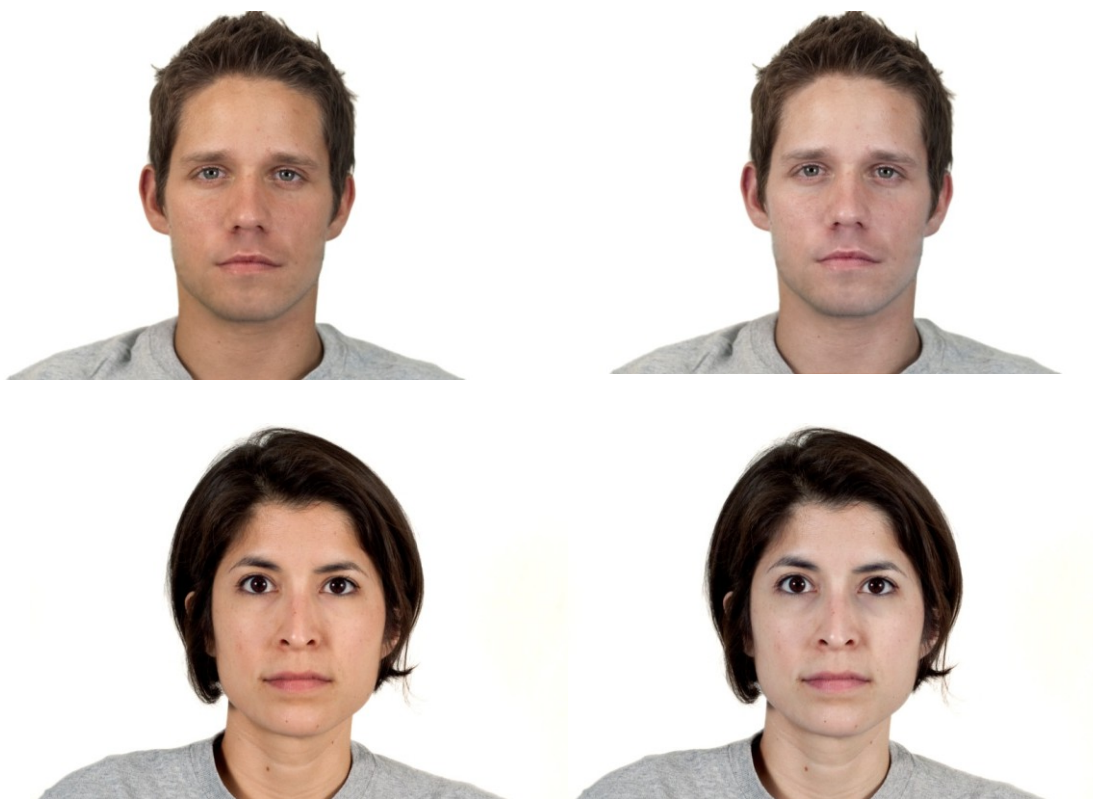
Slika 1. Primjeri fotografija zdrave (lijevo) i bolesne (desno) verzije lica.

podražajnim licima provedene su sljedeće manipulacije: boja kože posvijetljena je prema plavom spektru za 10 stupnjeva, kutovi usana spuštene su obostrano za oko 20 piksela (2mm) te su blago naglašeni podočnjaci za 2-4 posto od već vidljivih na originalnim fotografijama. Sve manipulacije izvedene su samo na koži lica, dok su boja pozadine, kose, očiju, obrva i odjeće ostale jednake kao na originalnim fotografijama. Primjeri fotografija prikazani su na Slici 1 .