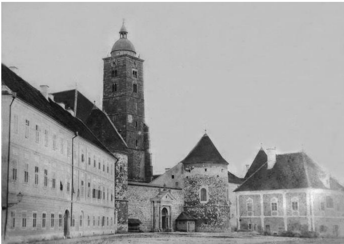
Slika 1. Črna škola na Kaptolu 2

Črna škola je, kako navodi Nives Opačić, naziv za zagrebačko sjemenište, a naziv nije dobila prema crnoj boji haljina koje su nosili bogoslovi, već se nastanak imena veže uz Franju Filipovića, zagrebačkoga kanonika. Filipović je svoju službu obavljao od 1567. do 1573. godine, dakle u vrijeme kada su se odvijali česti ratovi protiv Turaka. 1573. godine, Turci su ga zarobili i odveli u Carigrad, gdje se preobratio na islam i uzeo ime Mehmed, a prezime Filipović je ostavio. Zbog toga što je bio hrvatski plemić, dobio je titulu age, odnosno bega. Njegov se potez u Zagrebu smatrao veleizdajom, zbog čega su njegovu kuriju obojali u crnu boju, a od tada potječe naziv Črna škola 1 .