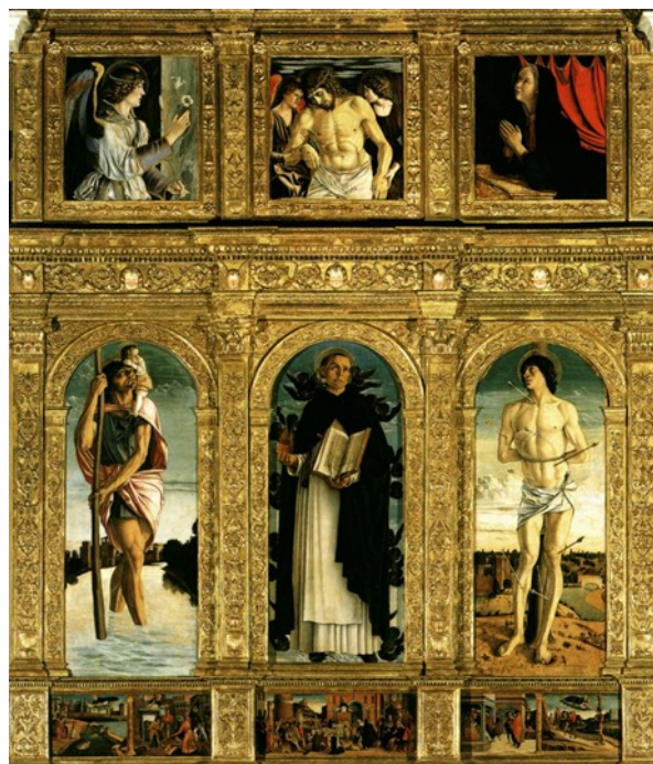
Slika 10 Giovanni Bellini, Poliptih sv. Vinka Ferrerskog , 1464. – 1468., tempera na dasci, bazilika Santi Giovanni e Paolo, Venecija

Budući da su dominikanci imali vodeću ulogu u suzbijanju hereze strogim inkvizicijskim procesima, Sveta je Stolica rado potpomagala jačanje njihova reda kanoniziranjem novih svetaca pa čašćenje sv. Vinka Ferrerskog postaje službenim 1455. godine u vrijeme pape Kalista III. (1455. – 1458.). 177 Venecijanska bratovština sv. Vinka Ferrerskog osnovana je i prije same kanonizacije 1450. godine, a njemu posvećen oltar s poliptihom Giovannijs Bellinija za dominikansku crkvu Santi Giovanni e Paolo naručen je 1453. i dovršen 1454. godine (Sl. 10). To potvrđuje da je već tada proces proglašenja sveca bio u punom zamahu, a venecijanski dominikanci spremni za širenje novoga kulta. 178 Uz svečev blagdan 5. travnja, u državnom kalendaru uvršteno je bilo i preseljenje njegovih relikvija u crkvu Santa Maria della Salute 1652. godine na dan 6. rujna, što se obilježavalo procesijom i posjetom dužda. 179