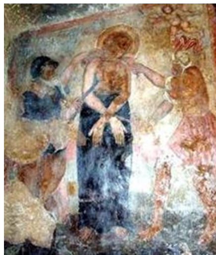
Slika 3 Mučeništvo sv. Febronije , XV./XVI. st., zidni oslik, bizantsko svetište sv. Febronije, Palagonija (Sicilija)

U ikonografiji se prikazuje njeno mučeništvo bičevanjem, vatrom, željeznim češljevima, a često je prikazana bez dojki, stopala i ruku te zubi (Sl. 3). 69