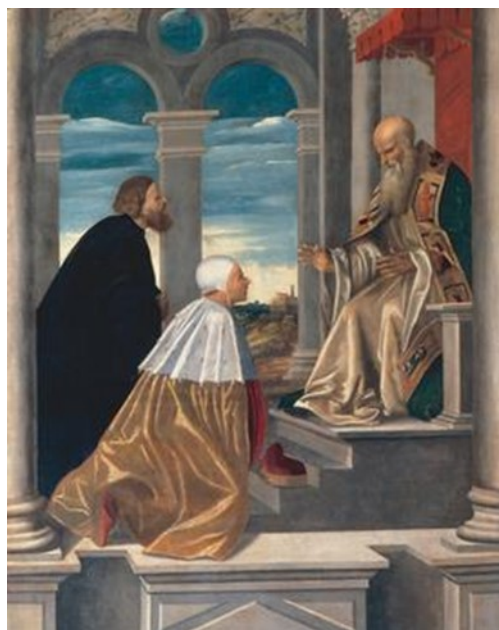
Slika 9 Giovanni da Brescia, Dužd Pietro Orseolo kleči pred sv. Romualdom , 1526., 22,8 x 28,4 cm, tempera na dasci, Museo Civico Correr, Venecija (izvorno dio dekorativne opreme orgulja u crkvi San Michele, Murano)

Rođen 928. godine u Veneciji, a umro 987. godine u Cuxi (južna Francuska), Pietro Orseolo poznat je kao venecijanski dužd i svetac. U dobi od dvadeset godina postaje admiral venecijanske flote, a 976. godine dužd za vrijeme političkih kriza koje je uspješno premostio. Dužnost je vršio dvije godine nakon čega odlazi iz Venecije i zaređuje se u benediktinskom samostanu u Cuxi, privučen propovijedima sv. Romualda (Sl. 9). Obnašao je službu samostanskog sakristana, sve do poodmaklih godina koje provodi u isposništvu. 168 Prvi znaci