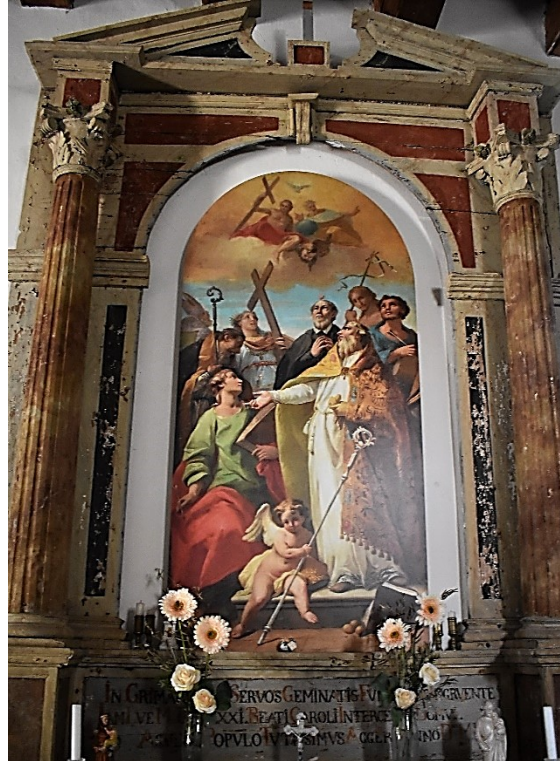
Slika 11 Kopija pale Presveto Trojstvo sa svecima na bočnom oltaru crkve sv. Roka u Svetvinčentu

glavnog simbola lava, na pali je prikazan i sv. Marko, uz bok sv. Nikole iz Barija, jednoga od važnih svetačkih likova čašćenih u gradu. Stoga se ne može govoriti o isključivo politički motiviranom odabiru prikazanih svetaca, no on svakako govori o mletačkoj kulturi u svijesti naručitelja.