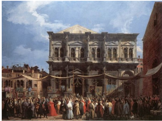
Slika 2 Canaletto, Svetkovina sv. Roka , 1735., ulje na platnu, 148 x 199 cm, National Gallery, London

(su)zaštitnikom grada uz sv. Teodora, koji je na neko vrijeme bio potisnut i zaboravljen u očima šire javnosti, dok je sv. Marko preuzeo ulogu glavnog i službenog zaštitnika grada. Ipak, kult sv. Teodora i dalje se zadržao u svijesti Venecijanaca što je dovelo do vizualnog povratka sveca u gradski prostor njegovim kipom na stupu (XIII. st.) podignutom kao pandan stupu s lavom sv. Marka na Piazzetti. 54