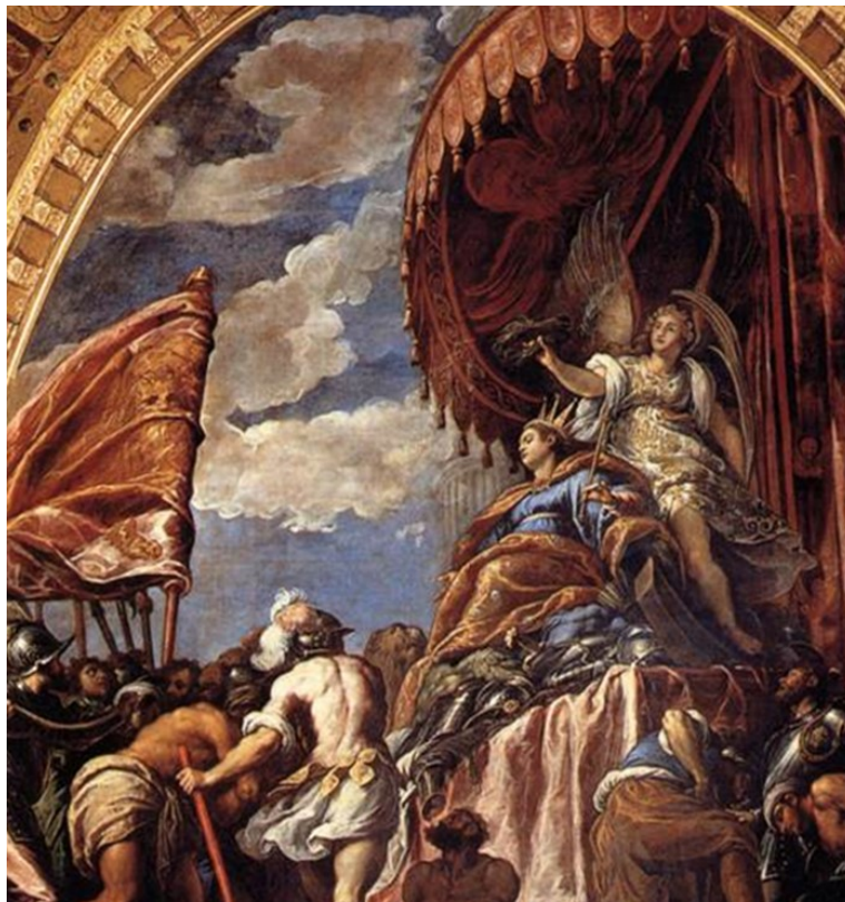
Slika 12 Slika Jacopo Palma Mlađi, detalj slike Pobjeda kruni Veneciju , 1584., ulje na platnu, Duždeva palača, Venecija

Vođena idejom Bogorodičine zaštite stvorila se slika Venecije kao neosvojiva grada, a državna uloga u tom posredovanju, osim putem lika sv. Marka, vizualno se naglašava i na druge načine. 191 Sukladno takvom mitu, formiraju se personifikacije Venecije povezivanjem ikonografije Pravde te pojedinih elemenata preuzetih iz Marijanskog kulta. Među prvim takvim personifikacijama je prikaz na reljefu pripisanom Filippu Calendariju u jednom od medaljona pročelja Duždeve palače iz 1345. godine. Prikazana je okrunjena žena na tronu jedne ruke položene na jednog od dva lava što je okružuju i s mačem u drugoj. Tako odjevena u jednostavne halje i ogrnuta plaštem, postala je ikonografski predložak za buduće personifikacije grada. 192 Stoljećima se, sve do propasti Republike zaposjedanjem francuskih snaga, ikonografski tip personifikacije Venecije javljao u sve složenijim varijacijama (Sl. 12).