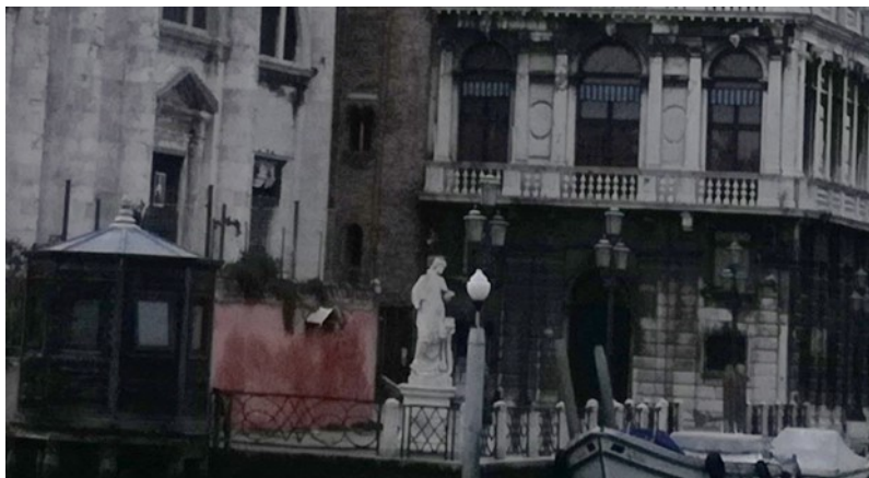
Slika 16 Giovanni Marchiori, kip sv. Ivana Nepomuka, mramor, Fondamenta Labia, Venecija

Iako se čašćenje sv. Ivana Nepomuka veže prvenstveno uz srednjoeuropski prostor i zemlje pod vlašću Habsburgovaca, njegov se kult, nevezan uz političke aspiracije, njegovao i u Veneciji. Popularnost mu se osobito razvila u svećeničkim redovima kao primjer pridržavanja ispovjednih pravila, a i u lokalnom čašćenju kao zaštitnika od acque alte (Sl. 16). Već 1737. godine proširio se teritorijem Republike, a službeno slavlje sveca u samom gradu potvrđeno je 1749. godine. Njegov se blagdan 16. svibnja uvrštava u venecijanski državni kalendar svetačkih slavlja tek 1791. godine. Dekretom Senata 1794. godine postaje zaštitnikom venetskog klera i uvrštava se u sporedne zaštitnike grada Venecije. 276