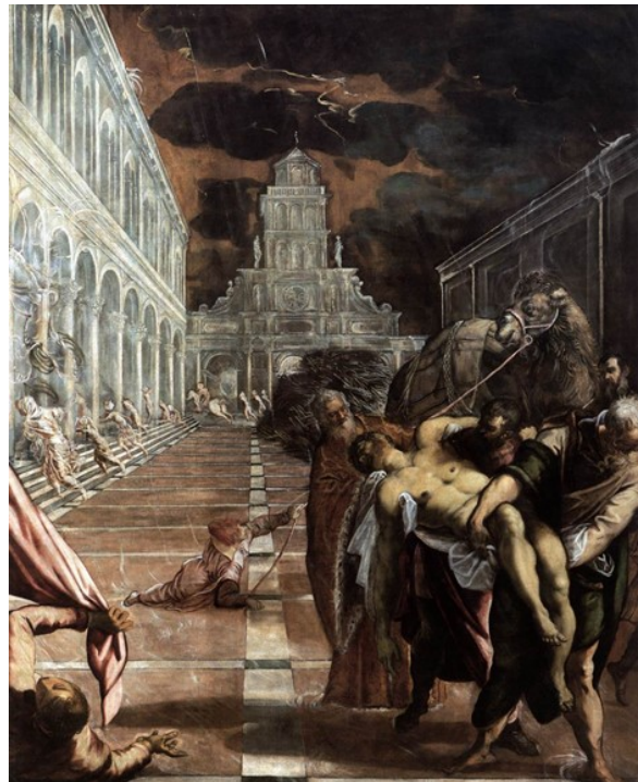
Slika 7 Jacopo de Robusti detto Tintoretto, Krađa tijela sv. Marka , 1562. – 1566., ulje na platnu, 398 x 345 cm, Gallerie dell'Accademia, Venecija