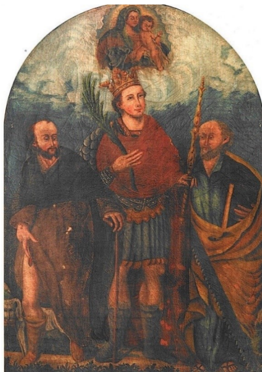
Slika 15 Lokalni majstor, Sv. Flor sa sv. Rokom i sv. Šimunom , XVIII. st., ulje na platnu, 125 x 90 cm, crkva sv. Flora, Kranjci

sv. Flor 610. godine otišao širiti evanđelje. 245 Biskupija Opitergioma obuhvaćala je područje Trevisa, u kojem se i danas nalaze sela Gornji i Donji sv. Flor što dodatno ukazuje na čašćenost