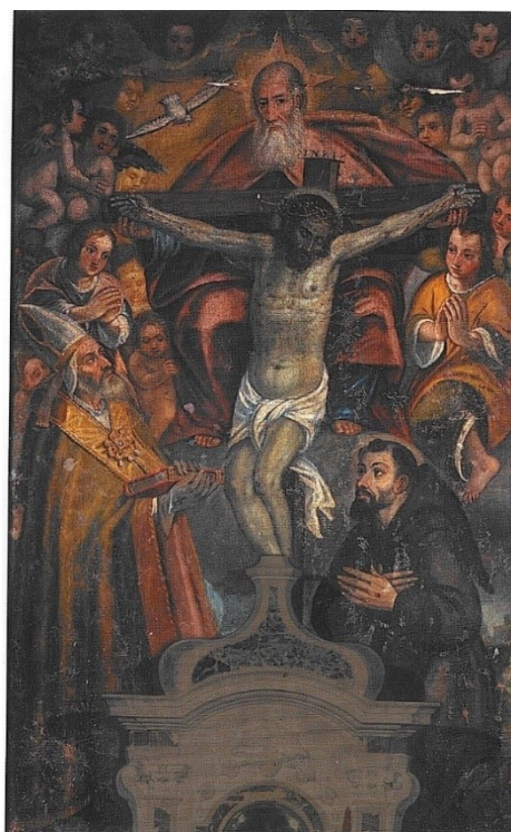
Slika 14 Antonio Moreschi, Priestolje Milosti sa sv. Florom i sv. Franjom Asiškim , početak XVII. st., ulje na platnu, 172 x 108 cm, župna crkva sv. Flora, Lobarika

sveca. Prema drugim legendama o svecu, smatra se da se po povratku iz propovjedništva nastanio u Fažani. 246