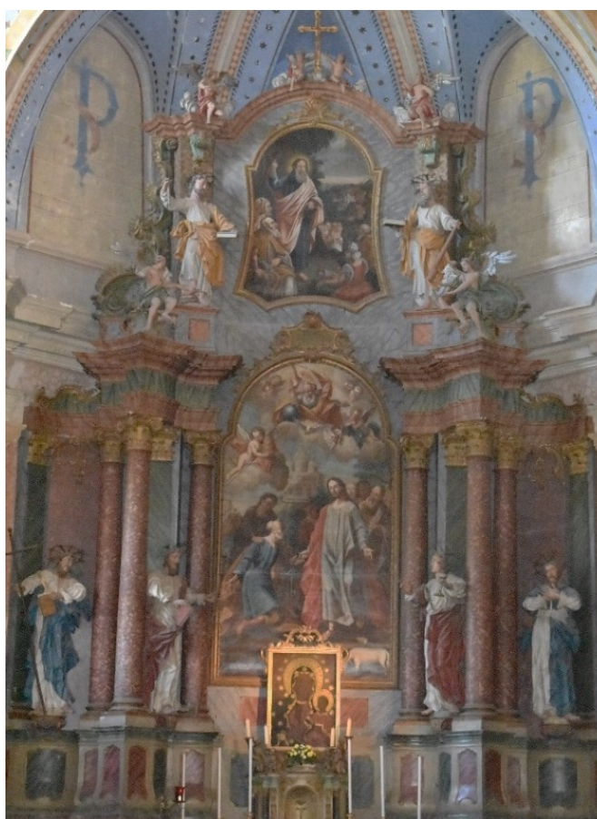
Slika 20 Paulus Riedl, glavni oltar župne crkve svetih Petra i Pavla, 1755., drvo, crkva svetih Petra i Pavla, Sveti Petar u Šumi

Upravo glavni oltar crkve svetih Petra i Pavla nosi sliku Majke Božje Częstochowske (kat. 2.11.1.2.) Leopolda Kecheisena, pavlinskog slikara u Svetom Petru u Šumi (Sl. 20). Kopija svete ikone uokvirena je pozlaćenim drvenim okvirom istovjetnim dekoraciji oltara na koji je postavljena. Kecheisenov rukopis prepoznaje se u oblikovanju pozadine s mnoštvom krilatih anđeoskih glavica koje je običavao umetati u svoja djela. Prema karakteristikama okvira, slika je zamišljena kao dio oltarne cjeline, stoga se može pretpostaviti datacija istovjetna oltarnoj pali prije 1755., godine posvećenja oltara. 430