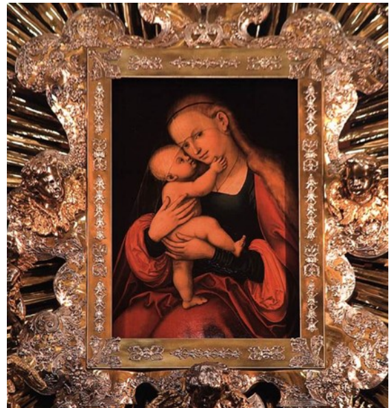
Slika 19 Lucas Cranach Stariji, Bogorodica s Djetetom , oko 1530., ulje na dasci, 40 x 24 cm, katedrala sv. Jakova, Innsbruck

Pošto je najsnažniji trag ostavio u njemačkim zemljama, kult Marije Pomoćnice poznat je pod nazivima Madona Auxiliatrix , Maria Hilf ili Mariahilf . Pobožnost šire i promoviraju redovnici napose kapucini. Karakteristike koje su kultu Pomoćnice dodijelili kapucini kao zaštitnice od heretika (protestanata) i nevjernika (osmanskih napada) dale su doprinos u snažnom valu širenja njezine pobožnosti. Posebice se na teritorijima pod habsburškom vlašću gdje su prodori Osmanlija bili česti, a protestantizam jačao, iskazivala pobožnost Mariji Pomoćnici. U skladu s time obilježavale su se zahvale Bogorodici za spas u Tridesetogodišnjem ratu (1618. – 1648.) tj. borbi s protestantima, te za konačno okončanje ratovanja kršćana s Osmanlijama pobjedom u Velikom bečkom ratu (1683. – 1699.). Time postaje i zaštitnica čitave Habsburške Monarhije, Tirola i Slavonije te simbol pobjede nad nevjernicima. 414