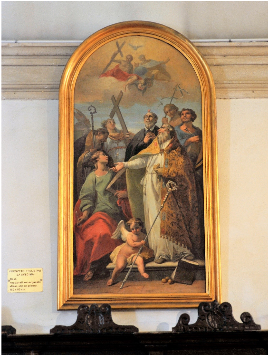
PRESVETO TROJSTVO SA SVECIMA 18. st. nepoznati venecijanski slikar, ulje na platnu, 180 x 85 cm