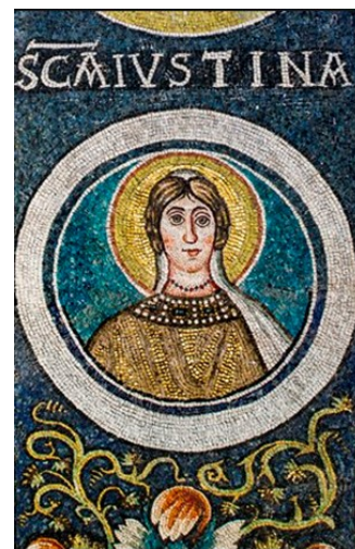
Slika 5 Neznani autor, Sv. Justina, VI. st., mozaik, trijumfalni luk, Eufrazijeva bazilika, Poreč

Poreč je kao grad snažnih kulturnih veza s Venecijom kult sv. Justine, osnažen nakon Lepantske bitke (1571.), svakako mogao preuzeti mletačkim posredstvom. No, kako je već spomenuto, jedan od prvih svetičinih prikaza zabilježen je upravo na mozaicima Eufrazijeve bazilike (VI. st.), pa je njezino čašćenje ovdje zacijelo imalo i lokalni karakter (Sl. 5). U prilog tome govori i uključivanje sv. Justine u galeriju svetaca zaštitnika Biskupije na zidovima glavnoga broda Eufrazijane.