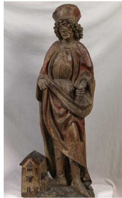
Slika 13 Neznani autor, kip sv. Florijana iz Lorcha, polikromirano drvo, XV. /XVI. st., 96 x 37 cm, Museo del Prado, Madrid

U umjetnosti je od XV. stoljeća prikazivan kao mlađi bezbradi rimski vojnik ili srednjovjekovni vitez uglavnom zrelije dobi s mačem, stijegom i štitom. Često bi mu bili pridodani atributi iz legendi: vjedro, vrč ili model gorućeg grada te križ na prsima, kao i simbol mučeništva – mlinski kamen oko vrata. 238 Najčešće se prikazuje s vjedrom vode dok gasi požar ili požarom zahvaćenu kućicu (Sl. 13). Kipići sveca često su se postavljali u niše kuća sjevernih krajeva za zaštitu. Često je njegov kip postavljen kraj javnih i privatnih fontana, a slike na kućama u svrhu zaštite od požara u Bavarskoj i Austriji. 239