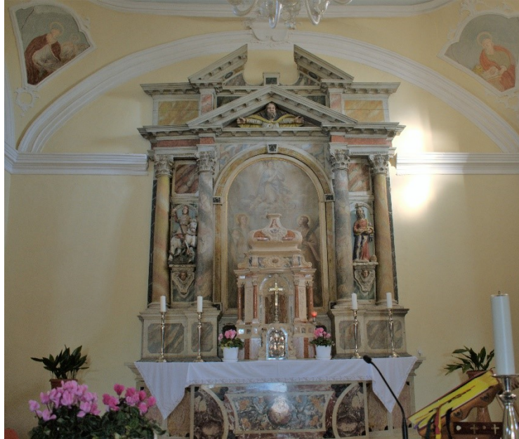
Slika 4 Neznani autor, oltar svetih Ivana i Pavla, XVII. st., mramor; drvo, župna crkva, Žbandaj

čašćenih u Veneciji, čiji se blagdani godišnje obilježavaju posebnim ceremonijalnim procesijama. Iako za vrijeme biskupa Negrija (Venecija; 1742. – 1778.) u Poreč dolaze venecijanski dominikanci iz samostana Santi Giovanni e Paolo, 107 nema drugih zabilježenih djela s prikazom ovih svetaca na porečkom području.