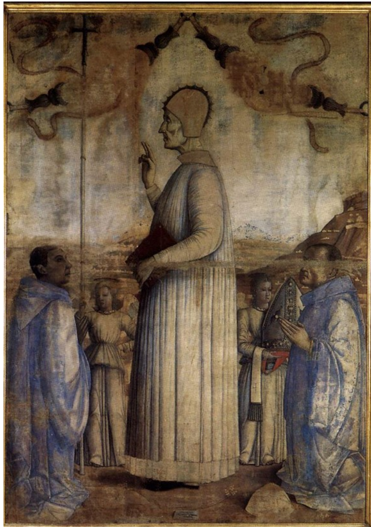
Slika 6 Gentile Bellini, Blaženi Lorenzo Giustiniani , 1465., tempera na platnu, 221 x 155 cm, Gallerie dell'Accademia, Venecija

Svetac se pojavljuje i u Istri na djelu sačuvanom u župnoj crkvi sv. Servula u Bujama, uz drugog mletačkog sveca, sv. Pietra Orseola. Sudeći prema učestalosti likovnih prikaza, čini se