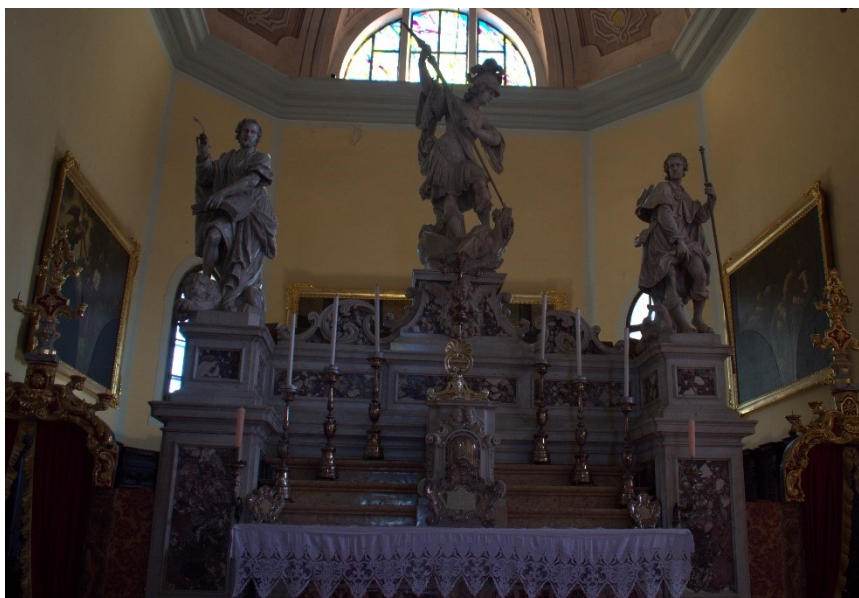
Slika 8 Girolamo Laureato; Alvise Tagliapietra sa sinovima, glavni oltar s kipovima svetih Marka, Jurja i Roka, 1739. – 1741., mramor, župna crkva sv. Jurja i Eufemije, Rovinj

Nemirna silueta rovinjskog kipa sv. Marka (kat. 1.6.2.3.) upućuje na novi ukus koji na mletačku umjetničku pozornicu stupa polovicom XVIII. stoljeća. Zašavši u suton bogate produkcije, autor glavnog oltara župne crkve svetih Jurja i Eufemije, Alvise Tagliapietra (Venecija 1670. – 1747.), u svoj stilski govor unosi rokoko elemente, jasno vidljive na posljednjim mu rovinjskim skulpturama izrađenim uz pomoć sinova.