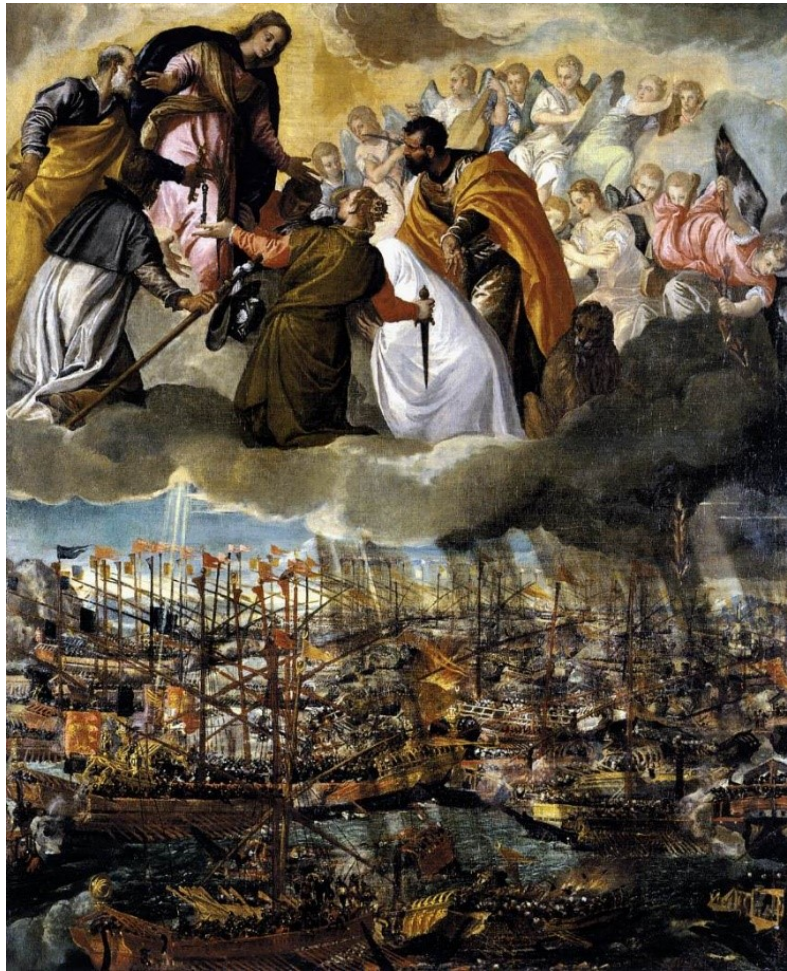
Slika 18 Paolo Veronese, Bitka kod Lepanta , 1572., ulje na platnu, 169 x 137 cm, Gallerie dell'Accademia, Venecija

od Pojasa, sv. Križ, Obrezanje Kristovo, Gospa Loretska. 386