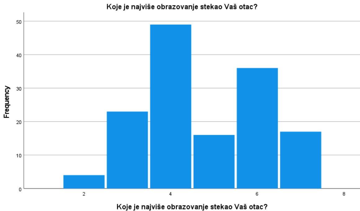
Slika 1: Najviše obrazovanje oca.

specijalizaciju, magisterij ili doktorat, za razliku od majki (7,6 %). Višu školu završilo je podjednako majki i očeva, dok 44,1 % majki ima završenu samo četverogodišnju školu, u usporedbi s 33,8 % očeva.