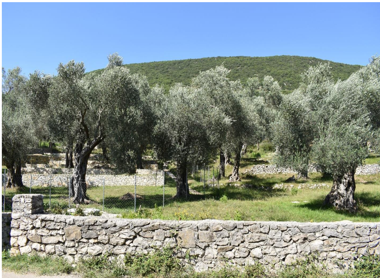
Slika 14. Stari maslinik u Ulcinju (fotografirala R. Geci, rujan, 2018. godine)

Nadalje, pitanje maslinika kao imovine danas čini javno i političko pitanje u Ulcinju. Riječ je o kolektivnom zahtjevu za povrat imovina ekspropiriranih 1978. godine, u tadašnjoj socijalističkoj Jugoslaviji. Po zahtjevu Vojnog pravobranilaštva u Titogradu 20 , kao predlagачu eksproprijacije, Odjeljenje za imovinsko-pravne poslove u Skupštini Općine Ulcinj, na osnovi Zakona o eksproprijaciji 21 i Zakona o opštem upravnom postupku 22 , 17. siječnja 1978. donijelo je rješenje o eksproprijaciji imovina u Valdanosu.