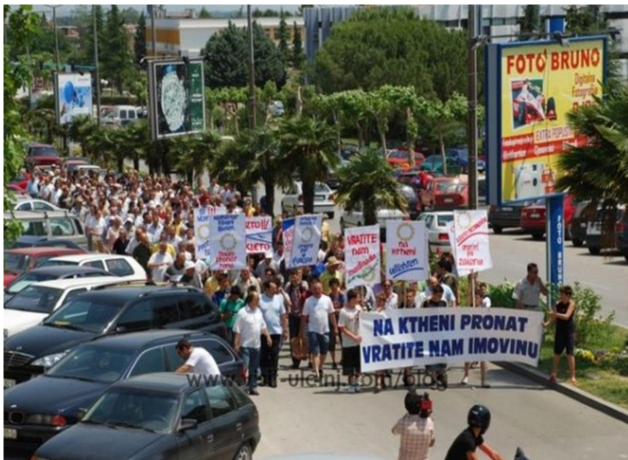
Slika 17. Protest za povrat imovine u Valdanosu 2011. godine

Kao rezultat brojnih reakcija i javnog pritiska, ali i neuspjeha sklapanja ugovora između kompanije Cubus Lux i Vlade Crne Gore, natječaj za zakup je poništen pa se stoga ni planovi za pretvaranje Valdanosa u turistički kompleks još nisu realizirali. Iz perspektive građana Ulcinja, sreća je što je još jedno opće dobro preživjelo i nije palo u ruke tzv. "tajkuna". Inače Ulcinjani podržavaju inicijative da se plaža i maslinik u Valdanosu pretvore u turističku destinaciju, ali na način da bude otvorena i dostupna svima, da se napravi šetalište gdje bi i mještani i turisti mogli uživati u prirodi i vidjeti maslinik kao element kulturne baštine Ulcinja. Isto tako, oni misle da tim kompleksom treba upravljati lokalna vlast, a ne da se događa, kao što je već slučaj u nekim drugim dijelovima grada, da velike turističke kompanije ne dopuštaju građanima ni šetnju unutar gradskih prostora.