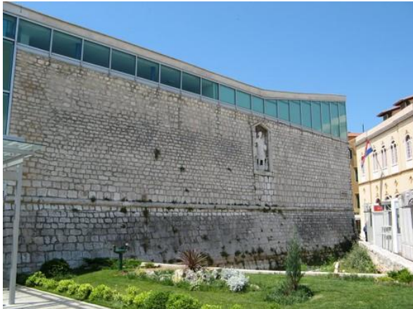
Slika 17. Zidine Poljana (lokalitet C) 66 Slika 18. Zidine Perivoj Roberta Visanija (lokalitet D) 67