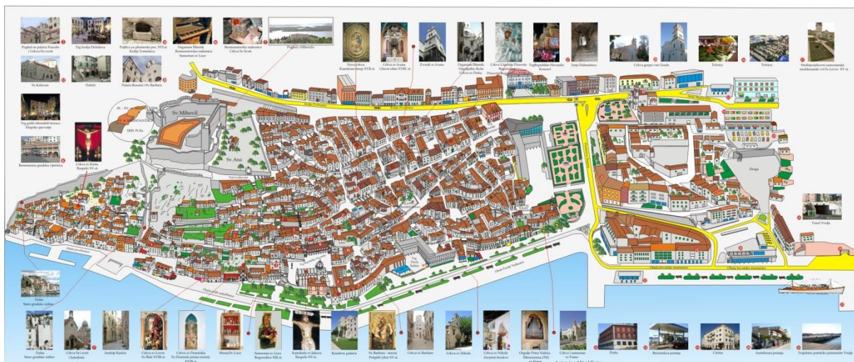
Slika 14. Plan grada 63