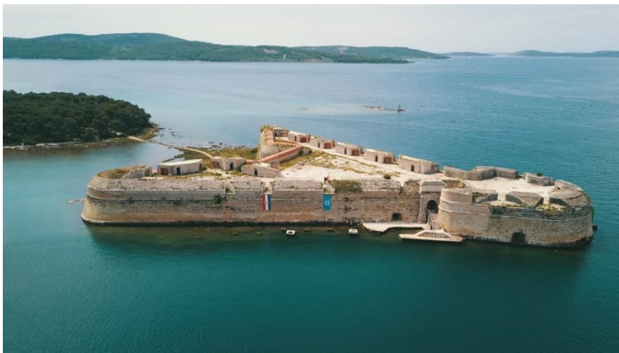
Slika 8. Tvrđava sv. Nikole 55