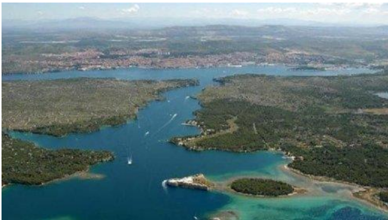
Slika 3. Šibenik i okolica iz zraka 47

Prikazuje se fotografija Šibenika i šibenske okolice (slika 3). Učenike se pita: Zašto se grad razvio baš na tom području? Koje su prednosti i mane takvog položaja? Cilj je da učenici uoče strateške prednosti grada i razlog zašto se grad pozicionirao baš na tom mjestu. Zatim se postavlja fotografija šibenske stare jezgre iz zraka koju sam već iskoristio u prethodnoj aktivnosti (slika 2). Učenike se pita: Zašto su ulice postavljene jako usko i nabijeno? Zašto je utvrda postavljena na brdo? Važno je da učenici shvate logiku planiranja gradnje grada u srednjem vijeku i da uoče na koji način reljef utječe na grad i njegovu infrastrukturu.