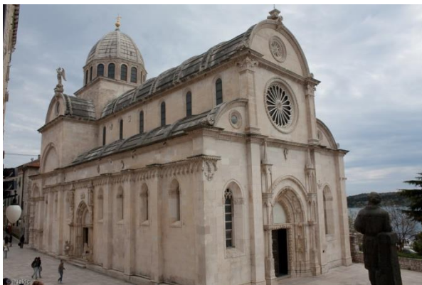
Slika 6. Katedrala sv. Jakova 53