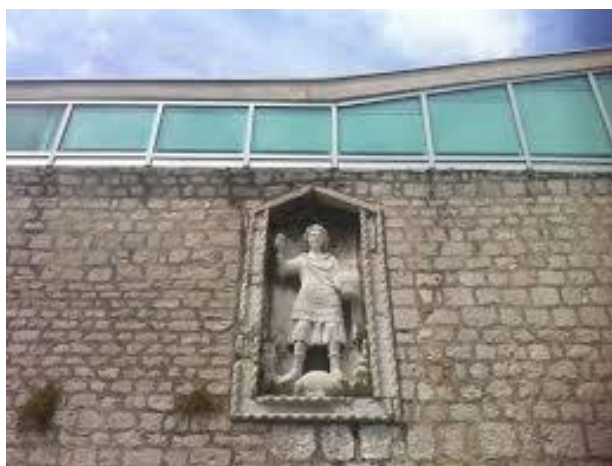
Slika 10. Sv Mihovil na zgradi knjižnice 58