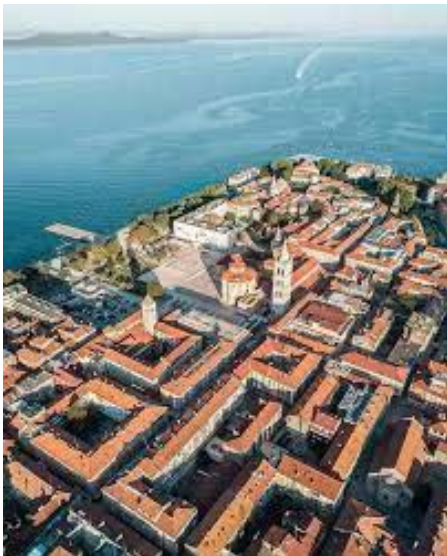
Slika 2. Šibenska stara gradska jezgra 46