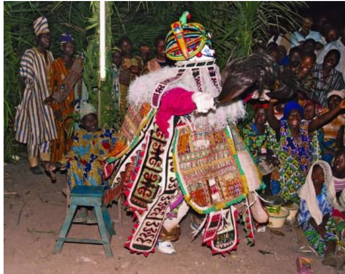
Slika 2: Kostimirana i maskirana osoba tijekom ceremonije Gelede 5

folklorni proizvod. Ipak, Gelede zajednica pokazuje veliku svijest o vrijednosti i potrebi za očuvanjem nematerijalne baštine, što se odražava u naporima koji se ulažu u pripremu za svečanost i u sve većem broju sudionika. Uz to ceremonija Gelede je uvrštena na UNESCO-ovu Reprezentativnu listu nematerijalne kulturne baštine čovječanstva (UNESCO „Oral heritage of Gelede“).