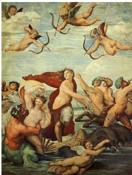
Slika 7: Rafael, Galatea , 1514., Villa Farnesina, Rim 15