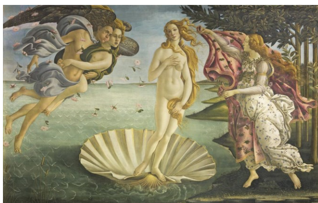
Slika 6: Sandro Botticelli, Rođenje Venere , c. 1485., Galerija Uffizi, Firenca 14

Iako se ovaj rad fokusira na nematerijalnu kulturnu baštinu, važno je istaknuti i utjecaj mitova i legendi na materijalnu kulturnu baštinu. Mnoge civilizacije su različitim metodama prikazivale svoje mitove i legende na svakodnevnim predmetima i u sklopu arhitekture. Legende i mitovi su s vremenom počeli gubiti značaj i funkciju koju su imali u društvu, ali su i dalje ostali kao inspiracija mnogim umjetnicima iz raznih područja. Neki od najpoznatijih europskih slikara često su kao temu koristili elemente iz priča klasične grčke i rimske mitologije. To se može vidjeti u primjerima poput: Rođenje Venere (Slika 6) i Proljeće S. Botticellija, Rafaelovom djelu Galatea (Slika 7), Narcis Caravaggia, i sl.