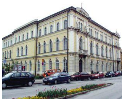
Slika 3. Odjel za odrasle.

Odjel za odrasle, namijenjen učenicima srednjih škola, studentima i odraslima, središnji je odjel Knjižnice i sadrži najveći dio njezina fonda (prikazan na Slici 3.). U otvorenom je pristupu uglavnom zastupljena beletristika, školska lektira, publicistika, novija znanstveno-popularna i stručna literatura, dok su manje tražene knjige, dublete, knjige na ćirilici, one koje traže poseban nadzor i zaštitu (rjeđa izdanja), posljednji primjerci pojedinih izdanja, reprint izdanja, knjige nestandardnog, vrlo malog ili velikog formata te pojedine stručne skupine u cjelini koje su zastupljene manjim brojem naslova pohranjene u zatvorenom spremištu koje se proteže na tri kata. 50 Pojedine su knjižnične zbirke, nažalost, zbog nedovoljnog kapaciteta prostora smještene u radnim prostorima djelatnika – odjelima za nabavu i obradu građe, tajništvu, u kojem je i županijska matična služba, te u ravnateljevu uredu. U ulaznom je dijelu čitaonica dnevnog i tjednog tiska, a uz posudbeni je odjel smještena studijska čitaonica s bogatom referentnom zbirkom. Za korisnike je Odjel otvoren svakog radnog dana od 7.30 do 19.30 s četiri djelatnika na raspolaganju u svakoj smjeni, subotom od 9 do 13 sati.