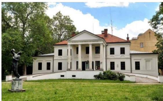
Slika 4. Odjel za djecu, Odjel za mlade i Odjel strane literature.

Na istom katu nalazi se i Odjel strane literature, u čijem su sastavu Zbirka strane literature, Zbirka Judaica te Zbirka multimedije. Najprije je osnovana Zbirka strane literature (1996.), čiji se fond sastoji od referentne građe, stručnih knjiga iz različitih područja, beletristike te časopisa na mnogobrojnim jezicima. Godine 2009. u fond je uvrštena Zbirka Judaica , koja je stigla iz SAD-a kao dar Židovske svjetske organizacije i sadrži oko šezdeset knjiga na engleskom jeziku. 53 Zbirku dijafilmova zamijenila je Zbirka multimedije, a glavninu njezina fonda čini glazbena građa.