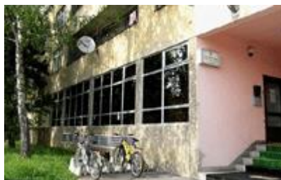
Slika 5. Ogranak Banfica.

Već je 1999. godine Gradska knjižnica planirala otvoriti ogranak u najnaseljenijem dijelu grada – na Banfici, no do realizacije je došlo 2002. godine (v. Sliku 5.) i tada je za početni fond izdvojeno iz Odjela za odrasle približno 4000 te iz Odjela za djecu oko 1000 knjiga. 54 Uz posudbeni dio organizirana je čitaonica dnevnog i tjednog tiska, a uređena je i manja studijska čitaonica s odabranom referentnom zbirkom.