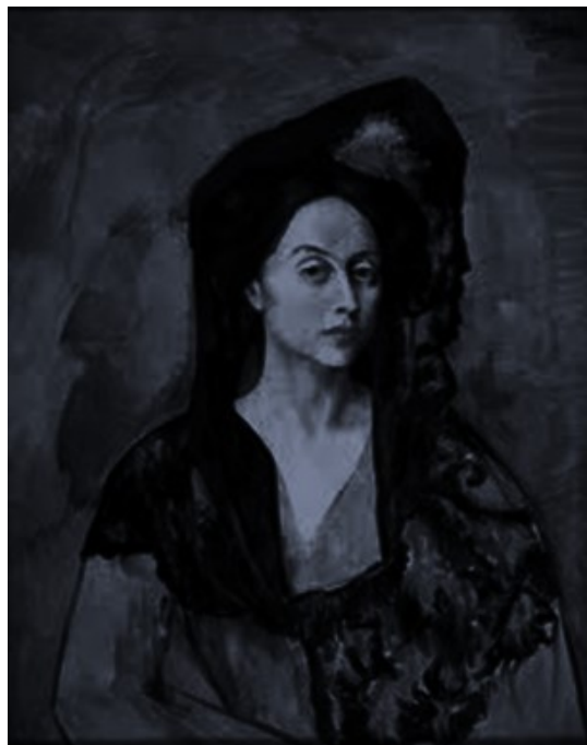
Slika 1: Pablo Picasso: Portret Madame Benedetta Canals

Sljedeća slika iz ove kategorije je „jedna Filipu nepoznata uljena slika iz četrdesetih godina: mlada žena u bjelini, držeći u ruci svijetloplavu vrpcu svog slamnatog šešira.“ 100 Ova nam je slika zanimljiva zato što se također odnosi na Filipovo nepoznavanje svoje majke i samoga sebe. Također, slika žene u bjelini povezana je s likom ženskog golog tijela jer obje ističu u kolikoj mjeri Filip ne poznaje vlastitu majku. Dvije slike nepoznatih žena naglašavaju „nesvodljivu distancu što Filipa i dalje dijeli od biološki najbliže osobe.“ 101