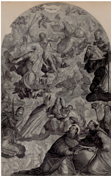
Slika 12. Raphael Sadeler, prema Paolu Piazzzi, Vizija sv. Dominika , 1607., bakrorez