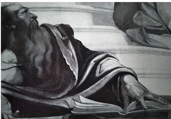
Slika 34. G. P. T. de Pomis, Krist predaje ključeve sv. Petru , oko 1615., ulje na platnu, Universalmuseum Joanneum, Graz, detalj