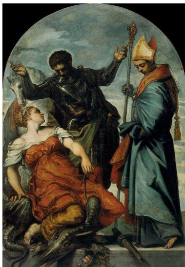
Slika 15. Jacopo Tintoretto, Sv. Juraj, sv. Ljudevit Tuluški i princeza , 1552., ulje na platnu, Galleria dell'Accademia, Venecija