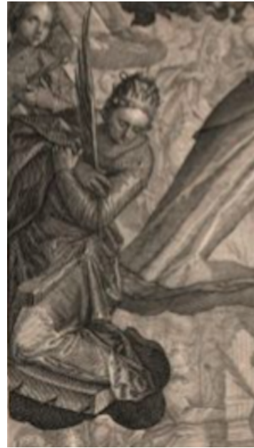
Slika 18. Raphael Sadeler prema Paolu Piazza, Vizija sv. Dominika , 1607., bakrorez, detalj