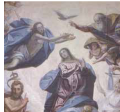
Slika 23. G. P. T. de Pomis, Primanje nadvojvotkinje Marije u nebo i krunidba Blažene Djevice Marije , 1608., ulje na platnu, crkva sv. Antuna, Graz, detalj