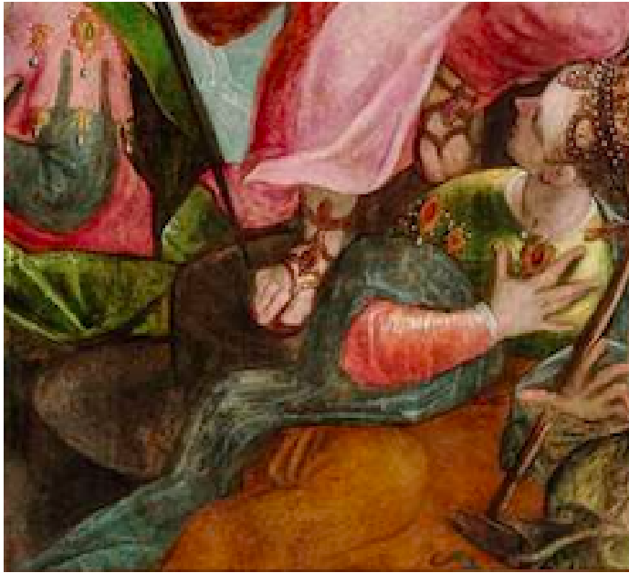
Slika 17. G. P. T. de Pomis, Nadvojotkinja Marija osniva samostan klarisa , 1603., ulje na platnu, Universalmuseum Joanneum, Graz, detalj