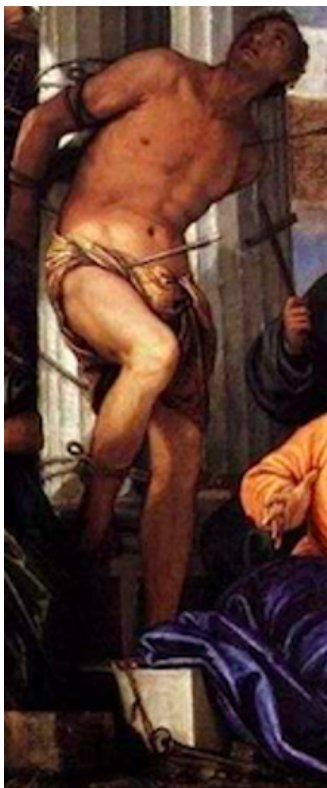
Slika 25. Paolo Veronese, Bogorodica s Djetetom u slavi sa sv. Sebastijanom , 1565., ulje na platnu, crkva sv. Sebastijana, Venecija, detalj