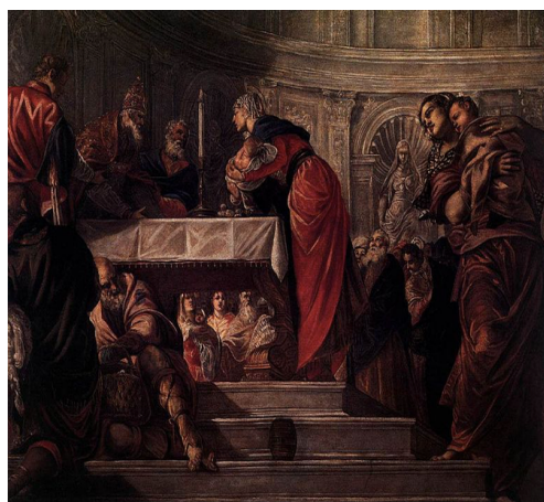
Slika 42. Jacopo Tintoretto, Prikazanje Krista u hramu , 1549., ulje na platnu, Santa Maria dei Carmini, Venecija

Stilske novosti na pali sv. Ane Trojne na Trsatu naspram drugih Pomisovih djela mogu se objasniti kasnijom datacijom djela. Različitost u njenoj kompoziciji, osim vremenom nastanka djela, može biti uvjetovana i kontekstom njene narudžbe. Naručitelj nije Habsburgovac, niti boravi u Austriji pa vjerojatno nije vidio Pomisova najpoznatija djela. Kao što je to već rečeno, naručuje djelo nakon smrti supruge, tako da je u središtu zanimanja obitelj, a ne vjersko-političke poruke te stoga nema potrebe za mnoštvom likova i nebeskim prikazima svetaca, Bogorodice i Krista okruženih anđelima koji se mogu shvatiti kao slavljenje »pravovjerja«. Na trsatskoj pali je dovoljan prikaz naručiteljeve obitelji i nekolicine svetaca u bliskom kontaktu sa Svetom obitelji.