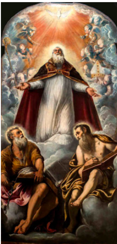
Slika 33. Jacopo Tintoretto, Sv. Marcel sa sv. Petrom. i sv. Pavlom , 1549., ulje na platnu, crkva San Marziale, Venecija