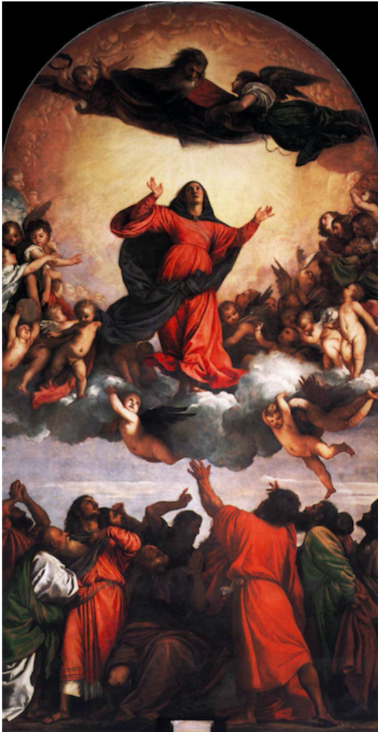
Slika 1. Tiziano Vecellio, Uznesenje Djevice Marije , 1516.–1518., ulje na platnu, crkva Santa Maria Gloriosa dei Frari, Venecija