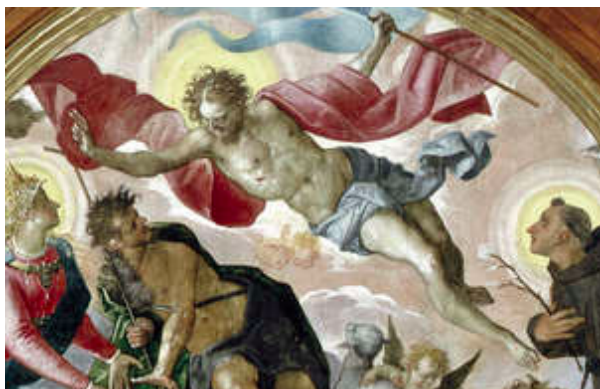
Slika 8. G. P. T. de Pomis, Apoteoza protureformacije , 1602., ulje na platnu, crkva sv. Antuna, Graz, detalj