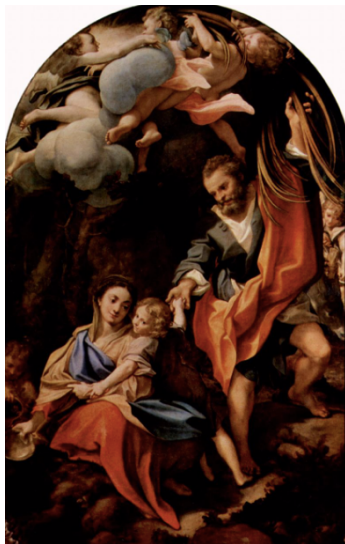
Slika 38. Antonio Allegri da Correggio, Madonna della Scodella , 1528.–1530., ulje na platnu, Galleria Nazionale, Parma