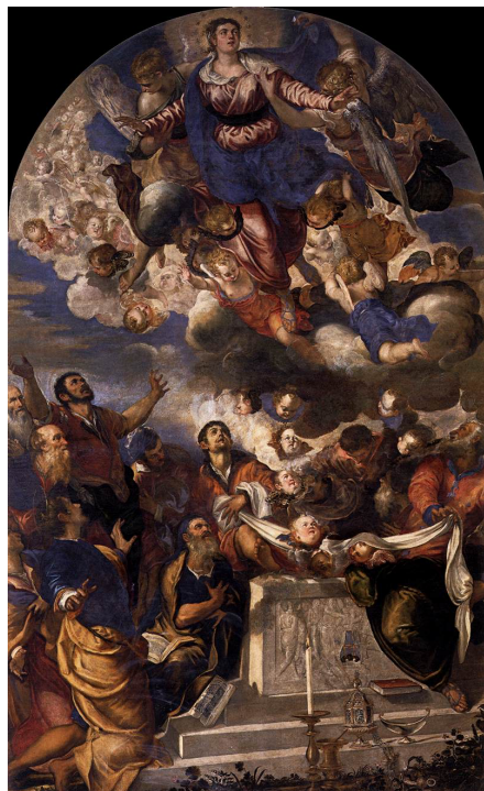
Slika 6. Jacopo Tintoretto, Uznesenje Bogorodice , kraj 1550tih/1560tih, ulje na platnu, crkva Santa Maria Assunta dei Gesuiti, Venecija