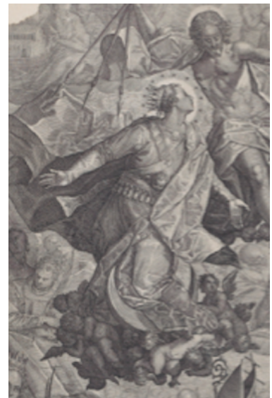
Slika 14. Raphael Sadeler prema Paolu Piazzzi, Vizija sv. Dominika , 1607., bakrorez, detalj