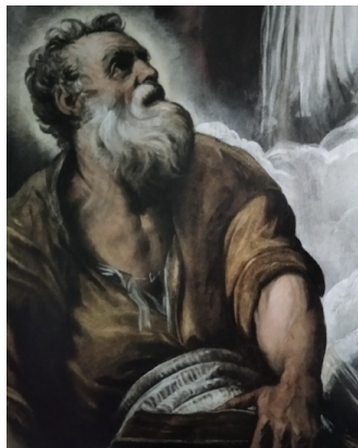
Slika 35. Jacopo Tintoretto, Marcel sa sv. Petrom. i sv. Pavlom , 1549., ulje na platnu, crkva San Marziale, Venecija, detalj