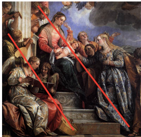
Slika 31. Paolo Veronese, Mistične zaruke sv. Katarine , 1565.–1670., ulje na platnu, Gallerie dell'Accademia Venecija, detalj