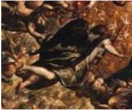
Slika 19. Jacopo Tintoretto, Raj , 1588.–1592., Sala Velikog vijeća, Duždeva palača, Venecija, detalj