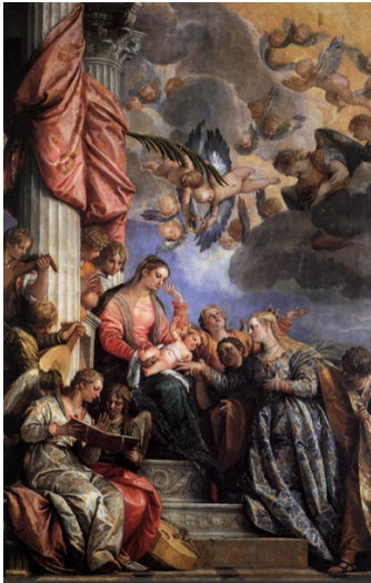
Slika 27. Paolo Veronese, Mistične zaruke sv. Katarine , 1565.–1670., ulje na platnu, Gallerie dell'Accademia, Venecija