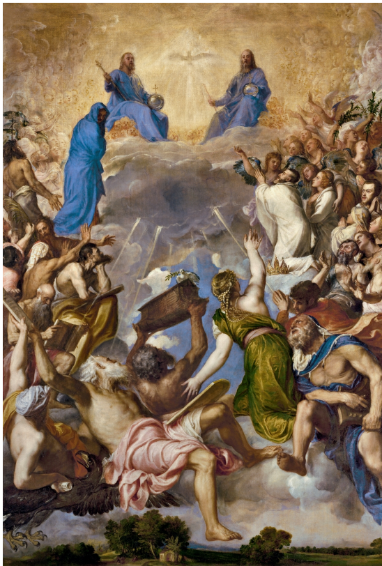
Slika 4. Tiziano Vecellio, La Gloria , 1551.–1556., ulje na platnu, Museo Nacional del Prado, Madrid