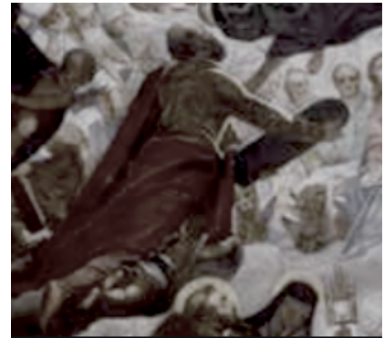
Slika 21. G. P. T. de Pomis, Primanje nadvojvotkinje Marije u nebo i krunidba Blažene Djevice Marije , 1608., crkva sv. Antuna, Graz, detalj