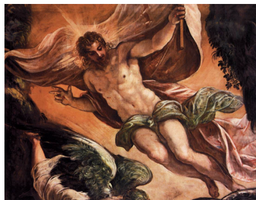
Slika 9. Jacopo Tintoretto, Kristovo Uskrsnuće , 1578./1581., ulje na platnu, Scuola Grande di San Rocco, Venecija, detalj