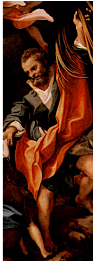
Slika 41. Antonio Allegri da Correggio, Madonna della Scodella 1528.–1530., ulje na platnu, Galleria Nazionale, Parma, detalj