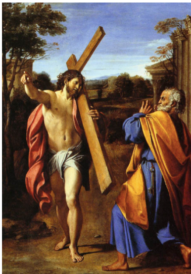
Slika 37. Annibale Carracci, Quo vadis? , 1601.–1602., ulje na platnu, The National Gallery, London

Draperija Pomisovog Krista, nagib tijela prema naprijed i gesta ruke pružene prema donjem, lijevom kutu slike, mogu se usporediti s figurom sv. Josipa (sl. 41) na slici Madonna della Scodella (sl. 38) nastaloj između 1528. i 1530. za crkvu Santo Sepolcro u Parmi, koja se danas čuva u Galleria Nazionale u istome gradu. Autor slike, manirist Antonio Allegri da Correggio, djeluje u Parmi, gradu u blizini Bologne kojeg je Pomis mogao posjetiti tijekom putovanja u Italiju, iako o tome nema pisanih dokaza. 111