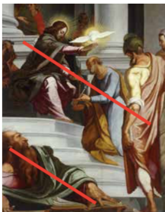
Slika 30. G. P. T. de Pomis, Krist predaje ključeve sv. Petru , oko 1615., ulje na platnu, Universalmuseum Joanneum, Graz, detalj