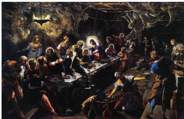
Slika 43. Jacopo Tintoretto, Posljednja večera , 1548., ulje na platnu, crkva sv. Franje Ksaverskog, Pariz