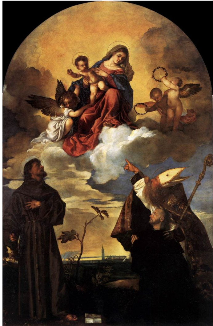
Slika 2. Tiziano Vecellio, Bogorodica s Djetetom sa svetim Franjom i sv. Vlahom te Alviseom Gozze , 1520., ulje na platnu, Museo Civico, Ancona