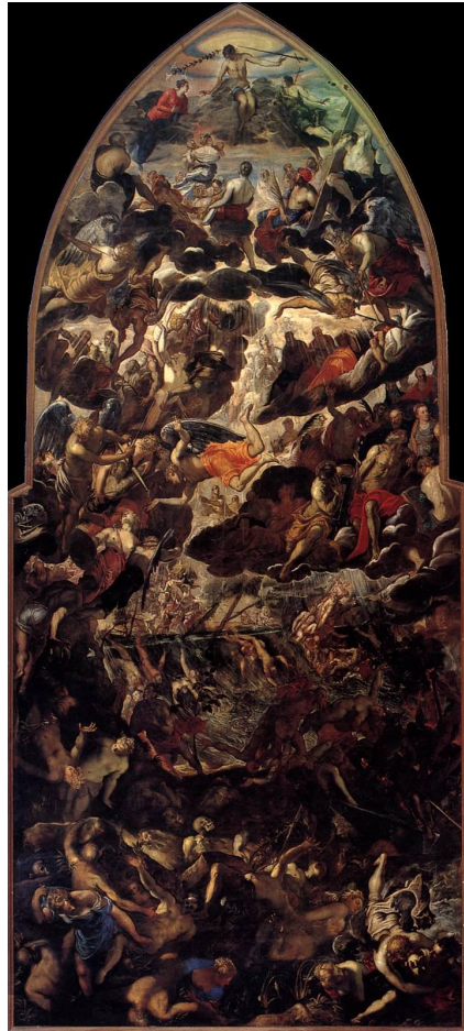
Slika 10. Jacopo Tintoretto, Posljednji sud , 1559./1560., ulje na platnu, crkva Madonna dell'Orto, Venecija