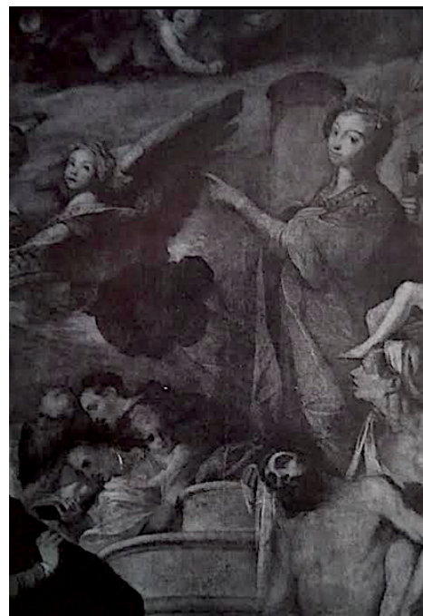
Slika 26. G. P. T. de Pomis, Marija Pomoćnica , 1611., ulje nasplatnu, crkva Marije Pomoćnice, Graz, detalj