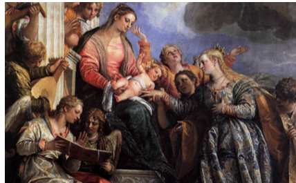
Slika 28. Paolo Veronese, Mistične zaruke sv. Katarine , 1565.–1670., ulje na platnu, Gallerie dell'Accademia Venecija, detalj