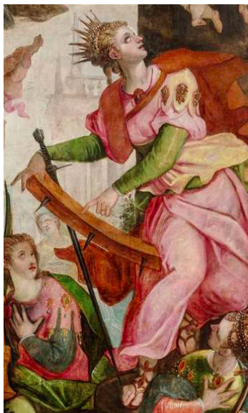
Slika 13. G. P. T. de Pomis, Nadvojotkinja Marija osniva samostan klarisa , 1603., ulje na platnu, Universalmuseum Joanneum, Graz, detalj