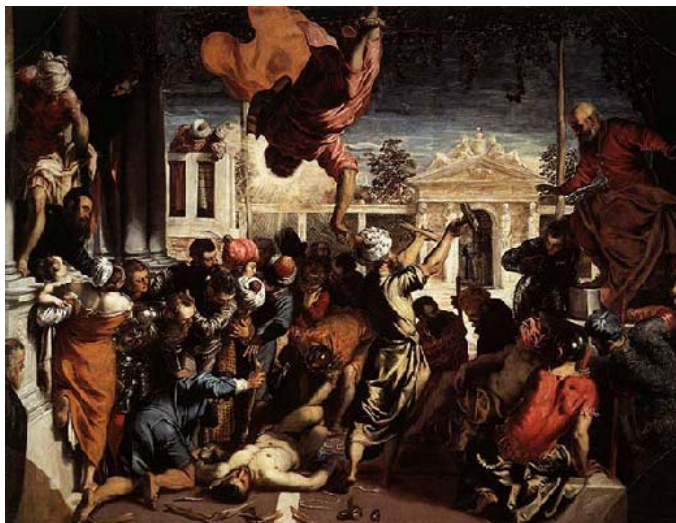
Slika 5. Jacopo Tintoretto, Čudo sv. Marka , 1547./48., ulje na platnu, Gallerie dell'Accademia, Venecija