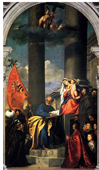
Slika 32. Tiziano Vecellio, Pala Pesaro , 1526., ulje na platnu, crkva Santa Maria Gloriosa dei Frari, Venecija