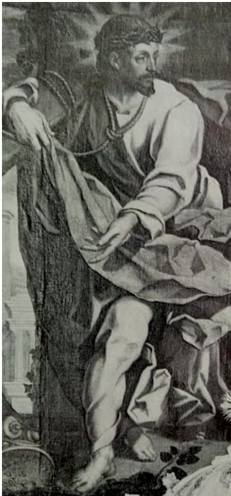
Slika 39. G. P. T. de Pomis, Vizija sv. Ignacija , 1618., ulje na platnu, katedrala u Grazu, detalj