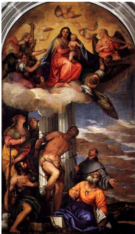
Slika 24. Paolo Veronese, Bogorodica s Djetetom u slavi sa sv. Sebastijanom , 1565., ulje na platnu, crkva sv. Sebastijana, Venecija