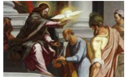
Slika 29. G. P. T. de Pomis, Krist predaje ključeve sv. Petru , oko 1615., ulje na platnu, Universalmuseum Joanneum, Graz, detalj