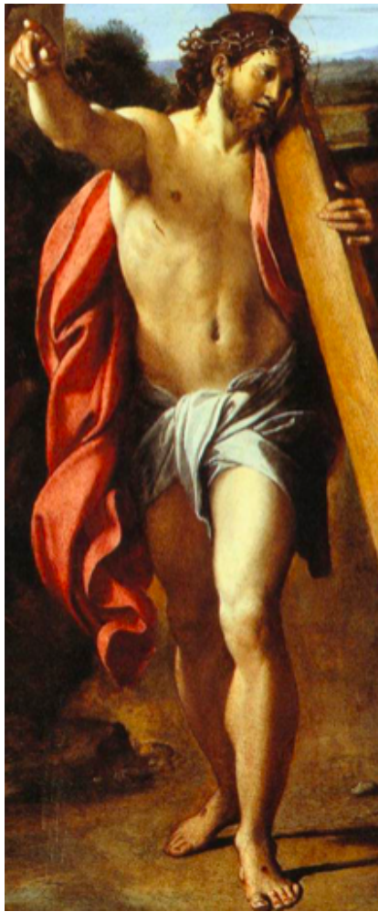
Slika 40. Annibale Carracci, Quo vadis? , 1601.–1602., ulje na platnu, The National Gallery, London, detalj