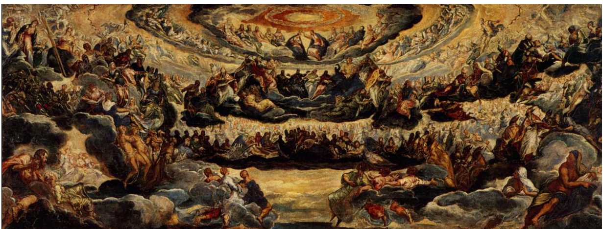
Slika 11. Jacopo Tintoretto, Raj , 1588.–1592., ulje na platnu, Sala Velikog vijeća, Duždeva palača, Venecija