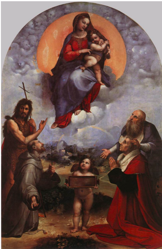
Slika 3. Raffaello Sanzio, Madonna di Foligno , 1511., ulje na dasci preneseno na platno, Pinacoteca Vaticana, Rim