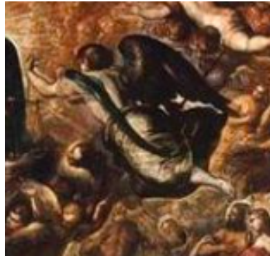
Slika 20. Jacopo Tintoretto, Raj , 1588.–1592., Sala Velikog vijeća, Duždeva palača, Venecija, detalj