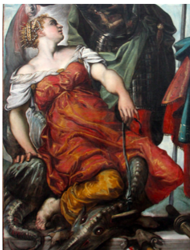
Slika 16. Jacopo Tintoretto, Sv. Juraj, sv. Ljudevit Tuluški i princeza , 1552., ulje na platnu, Gallerie dell'Academia, Venecija, detalj