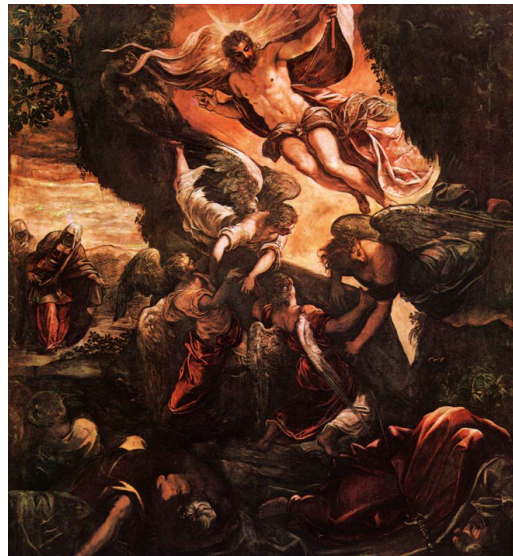
Slika 7. Jacopo Tintoretto, Kristovo Uskrsnuće , 1578./1581., ulje na platnu, Scuola Grande di San Rocco, Venecija