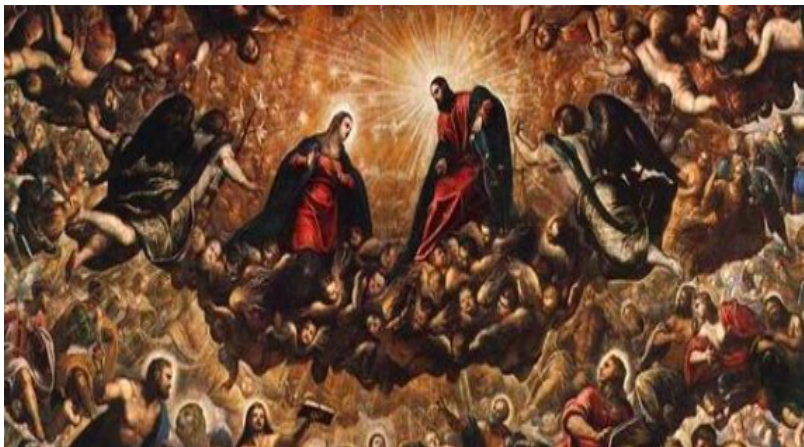
Slika 22. Jacopo Tintoretto, Raj , 1588.–1592., ulje na platnu, Sala Velikog vijeća, Duždeva palača, Venecija, detalj