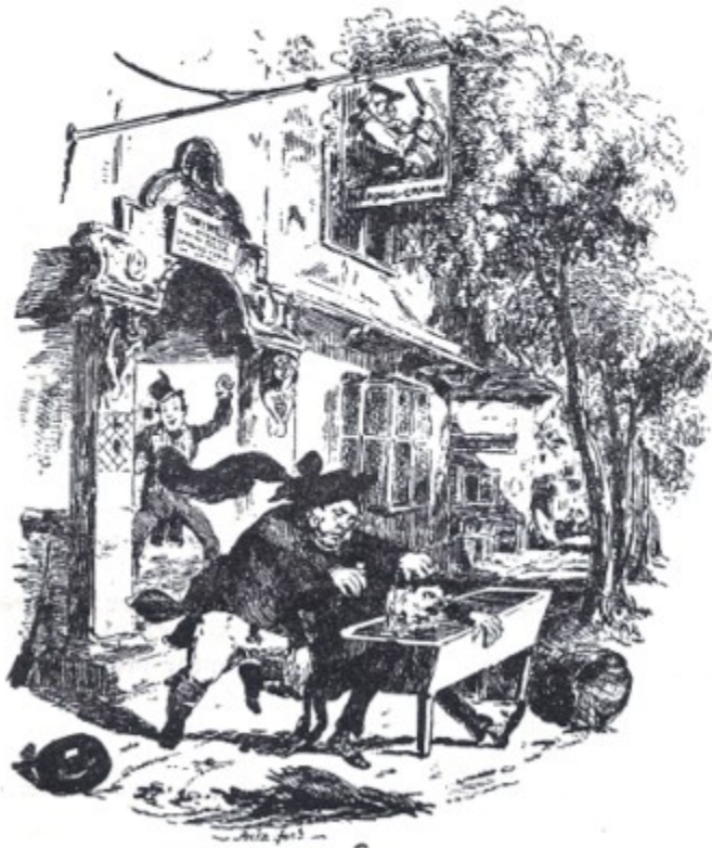
Frontispice de l'édition des « Pickwick Papers », par Phiz.