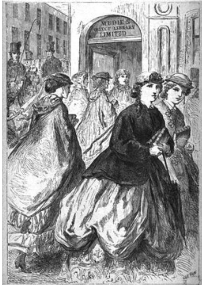
Slika 2: Ilustracija iz 1869. godine: posjet Maudie knjižnici

oblik romana u tri sveska. Međutim, usprkos pesimističnom pogledu autora na tržište knjiga, nije slučajnost što je i njegov roman bio objavljen u tri sveska. Naprosto u to doba nije postojala financijski isplativa alternativa, čega je i sam Gissing bio svjestan (Glover, 2012).