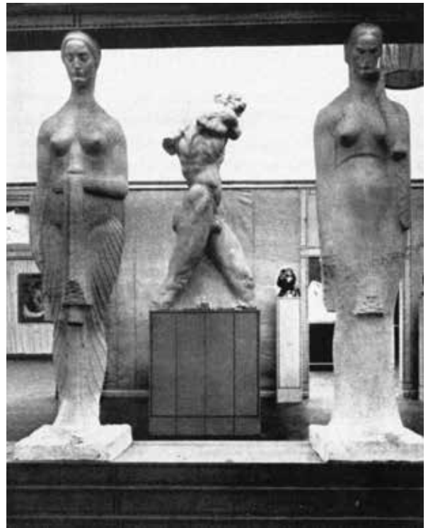
Ivan Meštrović, S izložbe Secesije u Beču, 1910. Ivan Meštrović, From the Secession Exhibition in Vienna, 1910

nik Neznamom junaku na Avali u Beogradu, Dom HDLU u Zagrebu, Njegošev mauzolej na Lovčenu), a i trajna zadivljenost Michelangelovim djelom 22 govori u prilog neprestanog i trajnog »osvrtnja«.