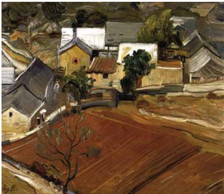
Ljubo Babić, Zagorski pejzaž (Novembar) , 1937., Moderna galerija, Zagreb Ljubo Babić, Zagorje Landscape (November), 1937, Modern Gallery Zagreb

utvrditi, da je taj naš osebujni izraz pri svom svršetku (...). Imajući u vidu te dvije suprotnosti, ta dva likovna svijeta, jedan potpuno primitivan i rustički, a drugi u svojim početnim fazama već urbanistički, razumjet ćemo i duboki jaz, koji ih dijeli. Jedan skroz na skroz vezan o potrebe i o tlo, izrastao iz rase, a drugi, da tako kažem, u zraku, nepovezan o svoju sredinu, u mnogo slučajeva i protivnik te sredine. Taj je drugi izraz pod stranim utjecajem izrastao zbunjen, ekonomski neuslovljen. 38