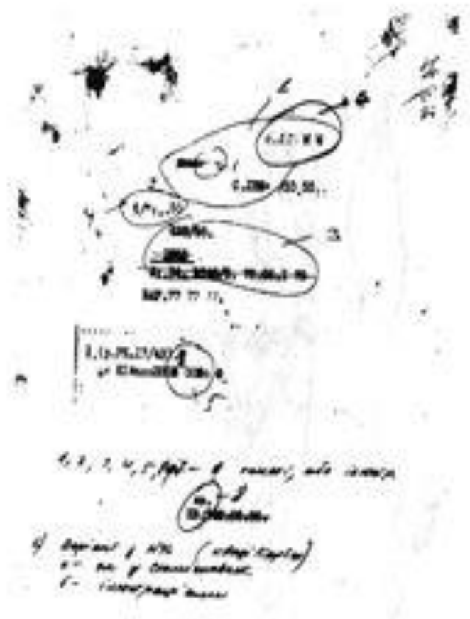
6 Острів КРК5

опускати, безпечити, логанити, поведінати, гвалтувати,