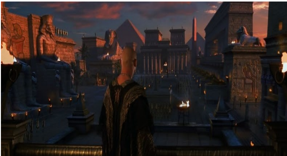
Slika 7. Isječak iz filma Mumija 2 , s prikazom drevnog Egipta

Baštinu možemo pronaći i u drugim filmskim žanrovima, preko povijesnih do akcijskih i filmova fantastike poput Mumije (Sl. 7.) ili Indiane Jonesa , koji često koriste baštinske elemente određenih kultura kako bi radnju smjestili u neki egzotičan, drugačiji prostor, prepun mitova i drevnih vjerovanja, pa do običnih romantičnih komedija koje se baziraju na prikazu druge kulture, poput filma Obiteljska čast , kroz koji se upoznaje kinesko-američka kultura. Čak i filmovi znanstvene fantastike često koriste baštinske elemente, od drevnih narodnih običaja i mitova, do arhitekture i geografskih lokacija.