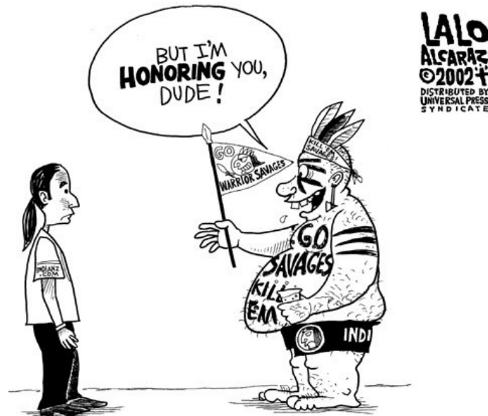
Slika 9. Karikatura Lalo Alcaraza koja prikazuje aproprijaciju baštine američkih Indijanaca

primjer aproprijacije baštine nešto nedopustivo te zahtijevaju promjena naziva. Kontroverza oko naziva kluba traje i dalje te je porasla do te razine da poznati svjetski mega-brandovi poput Nike-a i FedEx-a povlače svoje proizvode sa imenom Redskinsa i prijete raskidom sponzorstava, ako ime i dalje ostane nepromijenjeno.