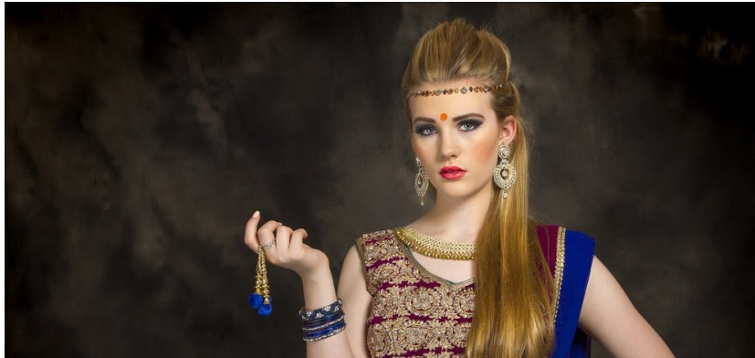
Slika 13. Primjer aproprijacije indijske kulture

koje ima iznimno spiritualno značenje za ove zajednice. Danas se bindi može vidjeti kao modni dodatak (Sl. 13.) koji se nosi na raznim glazbenim festivalima, ali je i čest modni izbor poznatih zvijezda, poput Madonne, Kylie i Kendall Jenner, te Selene Gomez. Iako je Rajan Zed, poznati hindu vođa izjavio da bindi ima značajno religijsko značenje i ne bi se trebala nositi kao modni dodatak 37 , mnoge indijske zvijezde, uključujući i glumicu Priyanku Chopra, su podržale ovaj trend, tvrdeći da se na taj način može prigriliti indijska kultura 38 .