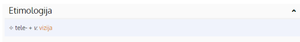
Slika 4. Primjer etimološke informacije kakvu nudi Hrvatski jezični portal

Kada se „televizija” pretraži u hrvatskome neetimološkom rječniku, korisnik se susreće s prvom poteškoćom. Naime, etimologija nije opisana pod natuknicom „televizija”, već je etimološku informaciju potrebno zasebno otvoriti klikom na poveznicu „vizija”. Ovakav je prikaz poveznice vidljiv na slici 4 69 .