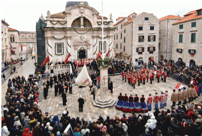
Slika br.1. Otvorenje Feste sv. Vlahe

Posljednju kategoriju, nematerijalnih kulturnih dobara, prožimaju običaji vezani uz obilježavanje crkvenih blagdana, dana svetaca, pohađanje svetišta i hodočašća. Upravo je ta baština inspirirala nove društvene procese koji su doveli do razvoja turizma. Tu vrstu turizma, putovanje motivirano vjerom, ovisno o prilici nazvat ćemo vjerskim turizmom, turizmom motiviranim vjerom, hodočasničkim turizmom ili hodočašćem. Razlog tome je između ostalog i nesuglasje između državnih i crkvenih autoriteta, koji osim što nemaju zajednički, integrirani plan i pristup vođenju i upravljanju kulturne baštine u Hrvatskoj, crkveni autoriteti izbjegavaju korištenje izraza vjerski turizam, bojeći se da bi mogao konotirati komercijalizaciju vjere. 12 Za potrebe ovog rada koristit ću pojam vjerski turizam, s naglaskom na hodočašća kao poseban oblik vjerskog turizma.