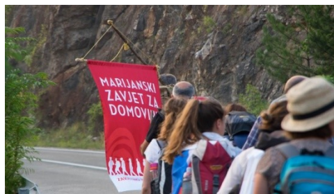
Slika br. 3. Hodočasnici na Marijanskom zavjetu za Domovinu