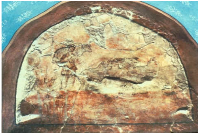
11. Luneta u baptisteriju kršćanske kuće u Duri Europos, oko 240. godine.