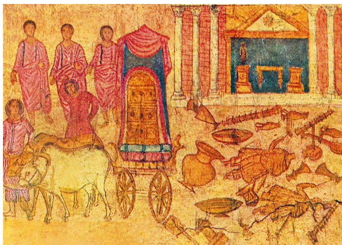
2. Scena sa zapadnog zida sinagoge u Duri Europos, registar B, Kovčeg Saveza u zemlji Filistejaca i hram Dagona, poruka protiv idolatrije, početak 3. stoljeća.