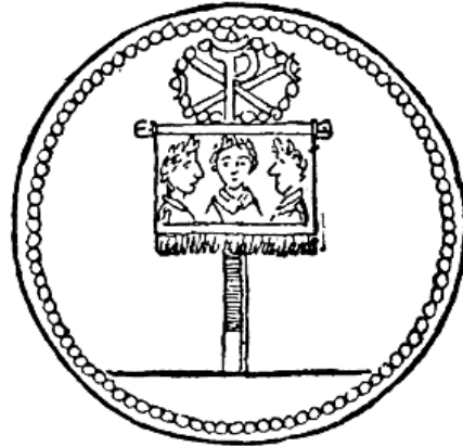
9. Prikaz Konstantinovog standarda na novcu.