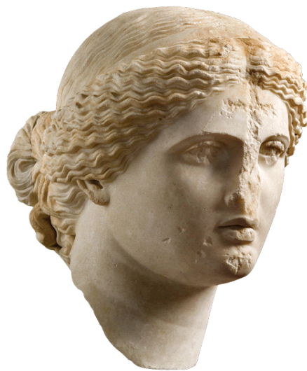
5. Glava Afrodite iz 1. stoljeća, s urezanim križem u čelo vjerojatno u razdoblju kasne antike.