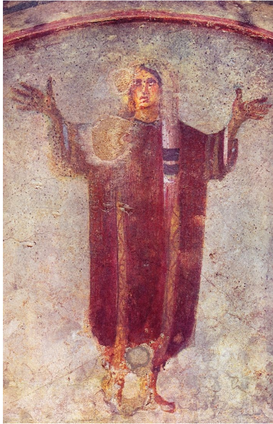
4. Figura u pozi molitelja orans , katakombe Priscille, Rim, 4. stoljeće.