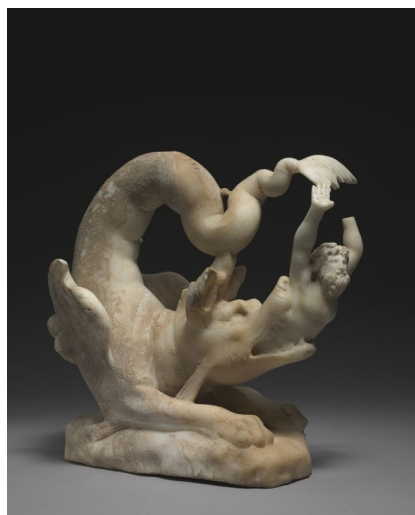
14. Skulptura iz grupe ciklusa o Joni, 41.50 x 36.00 x 18.50 cm, Cleveland Museum of Art, kraj 3. stoljeća.