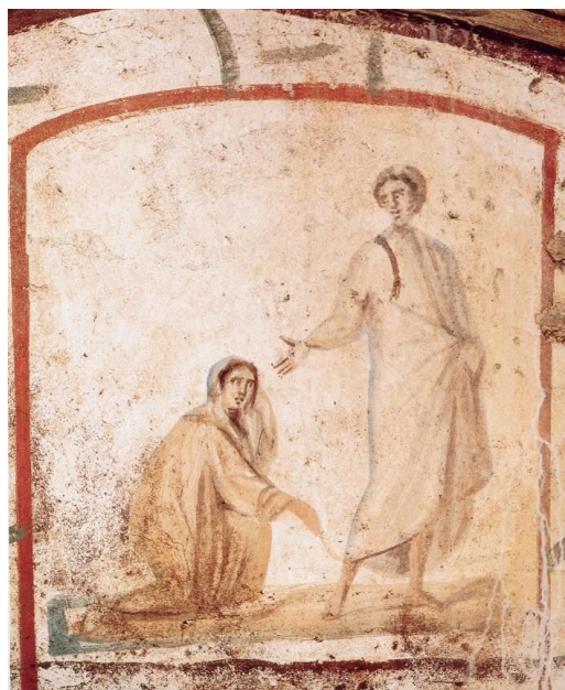
7. Krist i žena s krvarenjem, katakombe sv. Petra i Marcelina, Rim, kraj 3. ili početak 4. stoljeća.