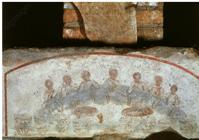
12. Scena Euharistijske večere iz Kalistovih katakombi, 3. stoljeće.