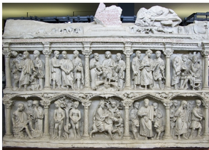
15. Sarkofag Junija Basa, Muzej bazilike Svetog Petra, Vatikan, 359. godina.