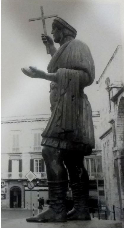
8. Kolosalna brončana skulptura cara iz Barlette, visina 3,55m, mogući Valentinijan I. (364.-375.) ili Marcijan (450.-457.).