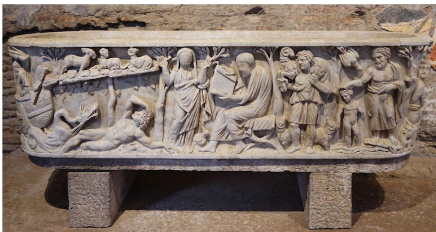
13. Sarkofag iz crkve Santa Maria Antiqua, Rim, oko 270. godine.