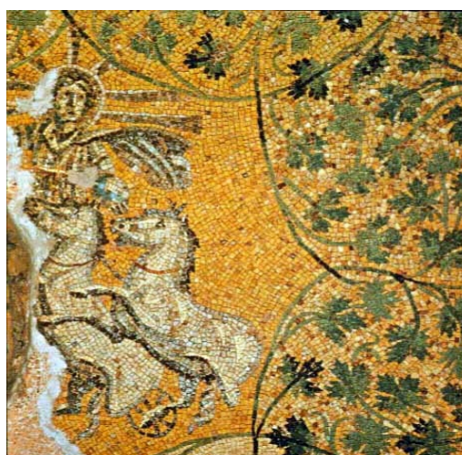
16. Krist kao Sol Invictus , svodni mozaik, grobnica ispod bazilike Svetog Petra, Rim, 3. stoljeće.