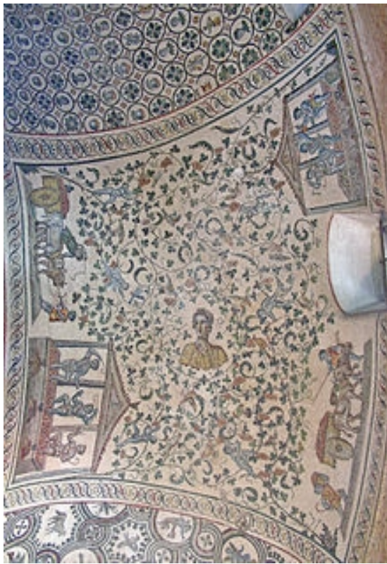
17. Detalj mozaika bačvastog svoda deambulatorija iz crkve Santa Konstanca s prikazima dionizijskih motiva, Rim, 320.-330. godina.