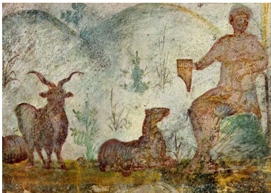
84. Rome, Catacomb of Domitilla. Orpheus-Christ with Animals, detail.