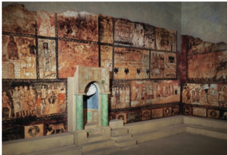
1. Židovska sinagoga iz Dure Europos, početak 3. stoljeća.