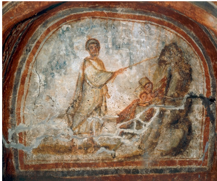
6. Mojsijevo čudo vode u pustinji, katakombe Komodile, Rim, 4. stoljeće.