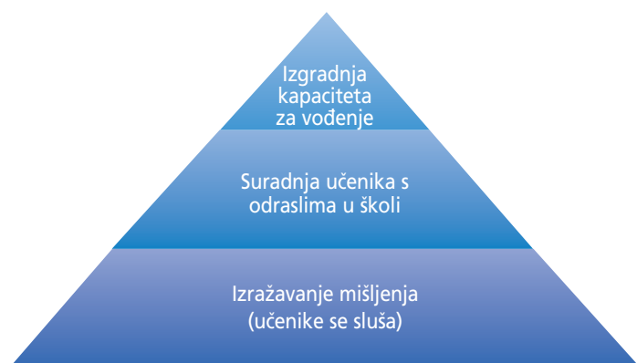
Slika 4. Piramida glasa učenika, prema Mitra (2005)

Gross (2009) navode kako recentna istraživanja pokazuju da suradnja učenika i odraslih u školi dovodi do niza poboljšanja u školi: unapređenja nastavnih planova, načina poučavanja i ocjenjivanja. Nadalje, sudjelovanje učenika na sastancima učiteljskih vijeća dovodi do promjene načina na koji se razgovara na tim sastancima i smanjenja neprimjerenih ponašanja odraslih. Suradnja učenika i odraslih u školi pozitivno utječe na razvoj njihovih odnosa te na razvoj novih kompetencija i učenika i nastavnika. Na vrhu piramide su aktivnosti koje se odnose na izgradnju kapaciteta za vođenje, te Mitra (2005) smatra da je to razina koja se najmanje ostvaruje u svakodnevnoj praksi. Na ovoj razini učenici imaju prilike sudjelovati u donošenju odluka, ali i preuzeti inicijativu te uputiti svoje kritike i prijedloge za unapređenje života u školi. U tom smislu, učenici preuzimaju inicijativu i mogu postati modeli svojim vršnjacima.