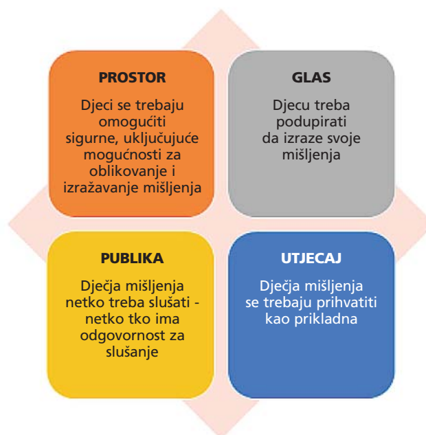
Slika 2. Model dječje participacije prema Lundy (2007)

šati („publika“) te priliku da se njihova mišljenja prihvate kao relevantna („utjecaj“). U tom kontekstu, Lundy (2007) smatra kako se članak 12. Konvencije o pravima djeteta mora promatrati u vezi s člankom 5. koji govori o odgovornosti odraslih da osiguraju usmjeravanje i vođenje u korištenju prava.