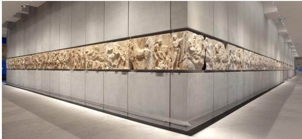
Slika 1. Prikaz zapadnoga i južnoga dijela partenonskoga friza u Muzeju Akropole ( Acropolis Museum – The Frieze, n.d. )