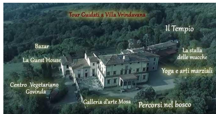
Slika 19. Villa Vrindavan, prikaz kompleksa

Mahabharate te ona ima karakter stalnog postava. Na katu se nalaze galerije koje prikazuju zabave Gospodina Rame te, nadalje, odabrane umjetničke slike ISKCON-a i prostoriju posvećenu A.C. Bhaktivedanta Swamiju Srila Prabhupadi, začetniku i osnivaču ISKCON-a. MOSA u Italiji također posjeduje i galeriju za povremene izložbe u bivšoj kapeli Ville Vrindavan. 54 MOSA također organizira i predstavlja svoje izložbe u raznim dijelovima svijeta, kao što je Nacionalna akademija umjetnosti u New Delhiju (ili Lalit Kala Academy ). 55