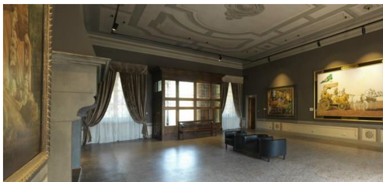
Slika 21. Izložbeni prostor MOSA-e u Villi Vrindavan 2

U razgovoru s Martinom Gurvichem, kustosom MOSA-e, saznali smo kako je u ožujku 2018. otvoren i ogranak MOSA-e u New Jagannath Puriju, na Tenerifima, a u tijeku su i pregovori oko otvaranja daljnjih ogranaka u Hagu, na mađarskoj ISKCON farmi i u Portugalu. U planu je također gradnja nove zgrade, koja bi se nalazila pokraj prve galerije u Radhadeshu i koja bi služila za izlaganje stalnog postava.