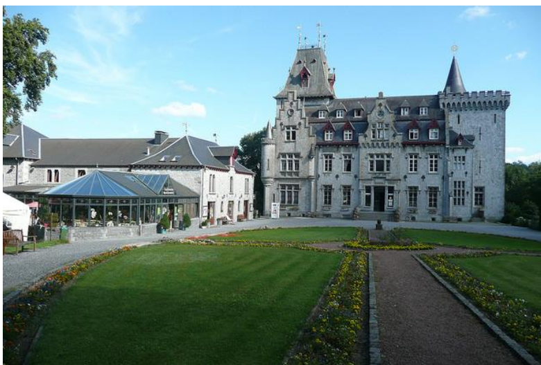
Slika 17. Radhadesh, glavni dio kompleksa (s lijeve strane možemo vidjeti prvu galeriju MOSA-e, koja se nalazi na prvom katu)