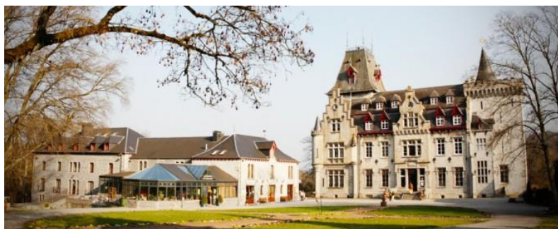
Slika 9. Radhadesh