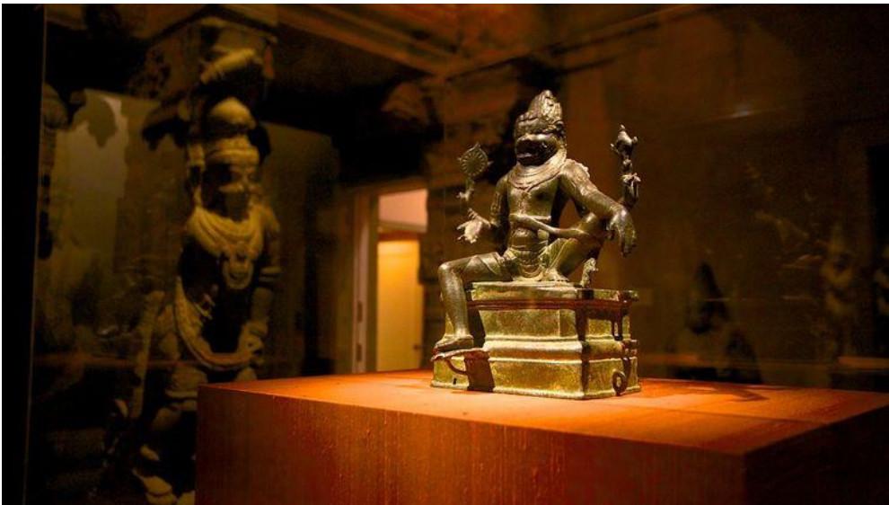
Slika 5. Philadelphia Art Museum : ponekad nam posjet muzeju može nalikovati posjetu hramu