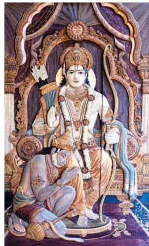
Slika 15. King Rama with Hanuman, His monkey warrior , P. Gowrajah