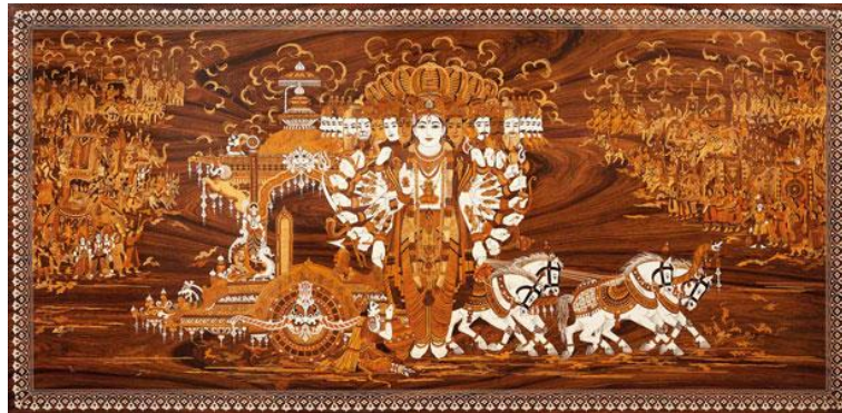
Slika 14. Vishvarupa Krishna reveals His dazzling universal form , P. Gowrajah

Vishvarupa Krishna reveals His dazzling universal form; Dashavatara, the ten divine forms of Vishnu; King Rama with Hanuman, His monkey warrior, umjetnika P. Gowrajaha. 49