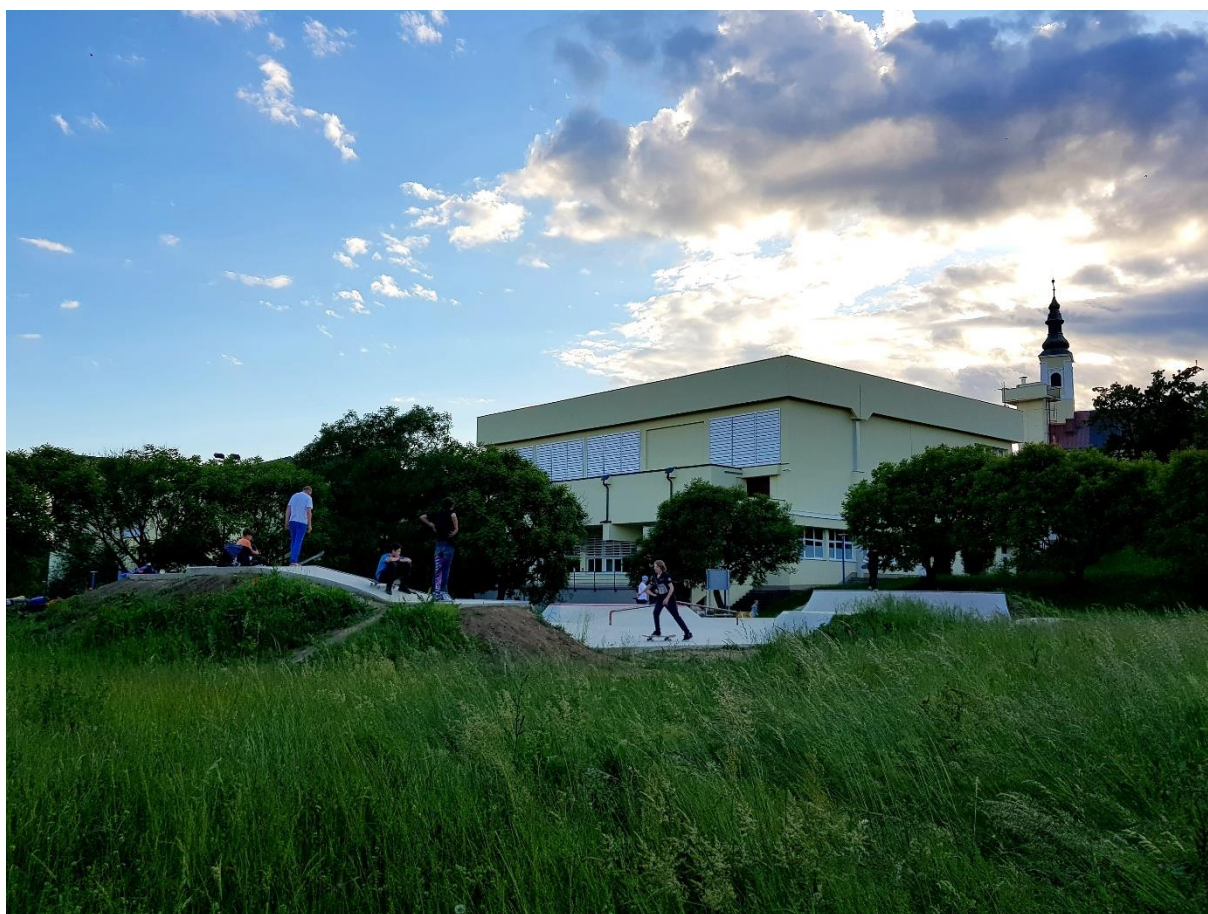
Slika 14. Sportsko igralište Skate park

Skate park nalazi se u blizini Osnovne škole Ksavera Šandora Gjalskog u Zaboku, ukupne površine 302 metra kvadratna, a sastoji se od osam rampi (Big transition x2, speed bump, funbox, rooftop, manual pad, small transition) i vozne površine koja povezuje rampe. Ideja o ovom projektu postoji od 2011. godine, a sam projekt realiziran je 2019. godine. Na inicijativu Dječjeg gradskog vijeća Zabok, ovaj je projekt prijavljen na natječaj LAG-a Zagorje-Sutla , a zadovoljava uvjete Strateškog cilja 3 Lokalne razvojne strategije LAG-a Zagorje – Sutla, Podrška održivom razvoju prostora kao temelj života budućih generacija . 112 S obzirom da je projekt sportskog karaktera, prvenstveno je namijenjen sportašima, ali i svim rekreativcima i ostalom stanovništvu. Cilj ovog projekta je stvaranje novog i adekvatnog prostora za rekreativno i aktivno bavljenje skateboardingom. Svrha je podizanje kvalitete