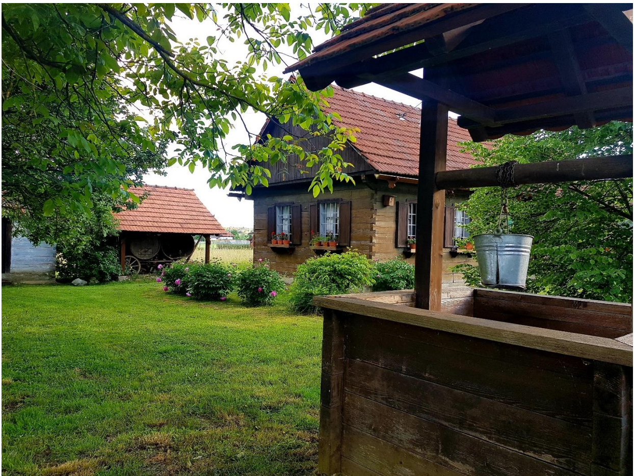
Slika 5. Etnolokalitet Zagorska hiža

Etnolokalitet Zagorska hiža u Dubravi Zabočkoj predstavlja još jedan element kulturne baštine grada. Prepoznata je njezina vrijednost kao kulturno-povijesne tradicije te se ulaže u njezino održavanje.