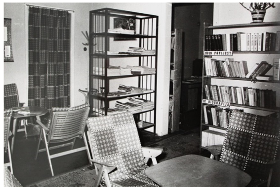
Slika 6. Prostor knjižnice u Mjesnom uredu