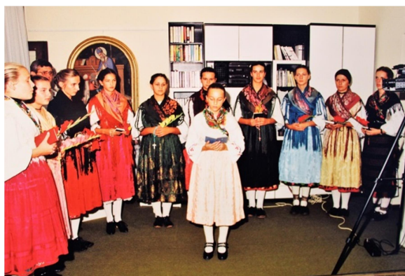
Slika 11. Nastup KUD-a „Orjlava“

Knjižnica i u ovome razdoblju obavlja ulogu središta lokalne zajednice, otvarajući svoj prostor za promicanje knjige, ali i drugih kulturnih djelatnosti te obrazovanja, kako za djecu tako i za poticanje individualnog usavršavanja odraslih organizacijom brojnih predavanja. Iako je ovaj period rada knjižnice obilježen problemima koji onemogućavaju napredovanje i razvitak knjižnice, kao što su neadekvatan prostor i nedovoljan broj djelatnika, što rezultira stagniranjem i kašnjenjem za ostalim knjižnicama istog tipa u Hrvatskoj u području računalne obrade knjižne građe te stvaranjem e-kalotoga pa i nedovoljnom komunikacijom putem