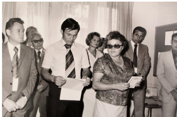
Slika 5. Otovrenje prostora u zgradi Mjesnog ureda

dječja i omladinska knjižnica i čitaonica, čitaonica za odrasle te knjižnica za odrasle). Prostor knjižnice pruža i mogućnost postavljanja izložbi.