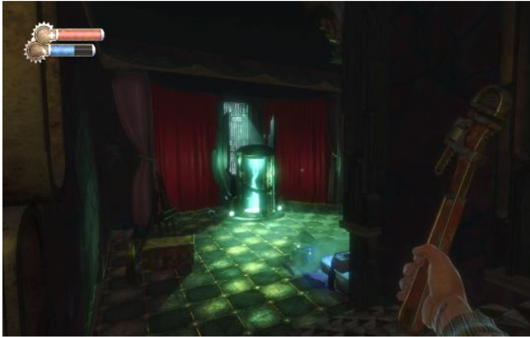
12. Izraženi efekt komore Vita Chamber, Irrational Games, BioShock Remastered , 2016.

Izuzev osvjtljenja koje primarno podržava gameplay , u BioShocku nailazimo i drugu vrstu osvjtljenja koje predstavlja iznimno uočljivo mjesto dodira s drugim umjetničkim vrstama: scenskom umjetnošću i filmom. Riječ je o scenskom osvjetljenju, koje je za razliku od prethodno opisanog, uglavnom u službi naracije i pojačava dramatičnost trenutka. Ono i dalje ispunjava funkciju primarnog osvjtljenja, ali nosi sa sobom još jednu značenjsku i umjetničku dimenziju. Primjer ovakvog osvjtljenja možemo naći već na početku uvodne razine Welcome to Rapture . Pri samom izlasku iz batisfere igrač se suočava s protivnikom zavijenim u tamu. U trenutku kada protivnik izvire iz mraka i kreće napasti još uvijek bespomoćnog igrača, aktivira se sigurnosni sustav i otvara paljbu na njega. Kao na kazališnoj sceni, svijetla se naglo prigušuju, a scena potjere popraćena je reflektorom. U dramatičnoj sceni protjerivanja igrač se prvi put vizualno upoznae s protivnikom pritom ne ostvarujući interakciju s njime – riječ je o insceniranom događaju u kojem je igrač tek pasivni promatrač, postavljen u ulogu publike.