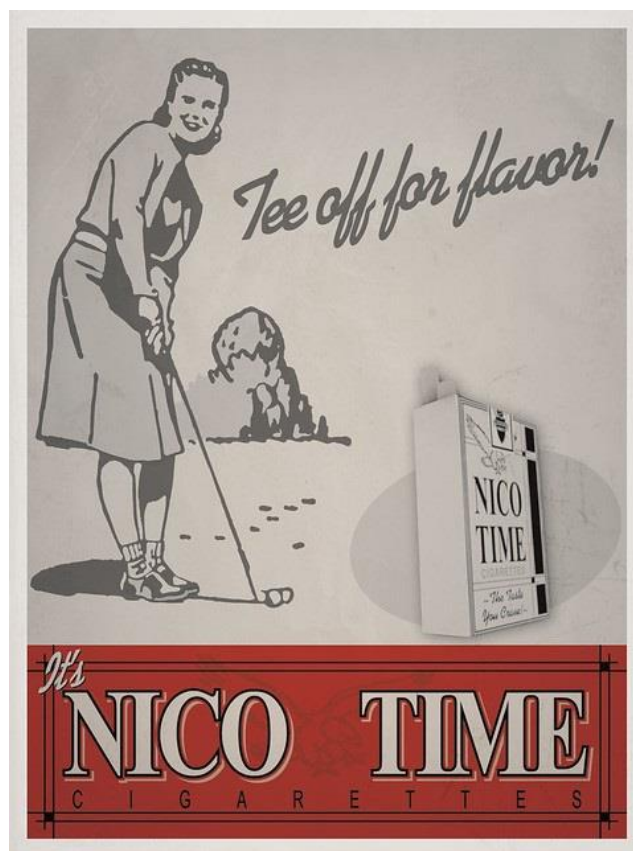
16. Plakat Nico Time Cigarettes , https://bioshock.fandom.com/wiki/Cigarettes

Svijet Rapturea vrvi od sveprisutnih reklama – svaki prostor, proizvod, usluga i osoba velikodušno su promovirani. Tu su plakati koji promoviraju javni prijevoz u Raptureu i odražavaju stvarnu popularizaciju luksuznih prijevoznih sredstava 30-ih godina (sl. 15). Plakat Atlantic Express vjeran je obilježjima plakata A. M. Cassandrea – dijagonala naglašava pokret, a tu su i plošnost i variranje intenziteta boja čime se dodatno naglašava dinamika. Nju možemo primijetiti i na plakatima više kulturne prirode poput plakata za predstavu Patrick & Moira (sl. 17) i za glasovire Champion Pianos . (sl. 18) Na njima također primjećujemo naglašenu vertikalnu te postupke geometrizacije i stilizacije. Tu je i izraženi crno-bijeli kontrast boja koji kod Patricka & Moire naglašava scenski karakter, dok je kod Champion Pianos razbijen crvenim tonovima. Uz reklame za glasovir tu je i cijeli niz fiktivnih marki proizvoda od koji su za međuratno razdoblje iznimno karakteristične cigarete. U BioShocku se pojavljuje nekoliko konkurentnih marki, a među njima grafički se najviše ističe Nico