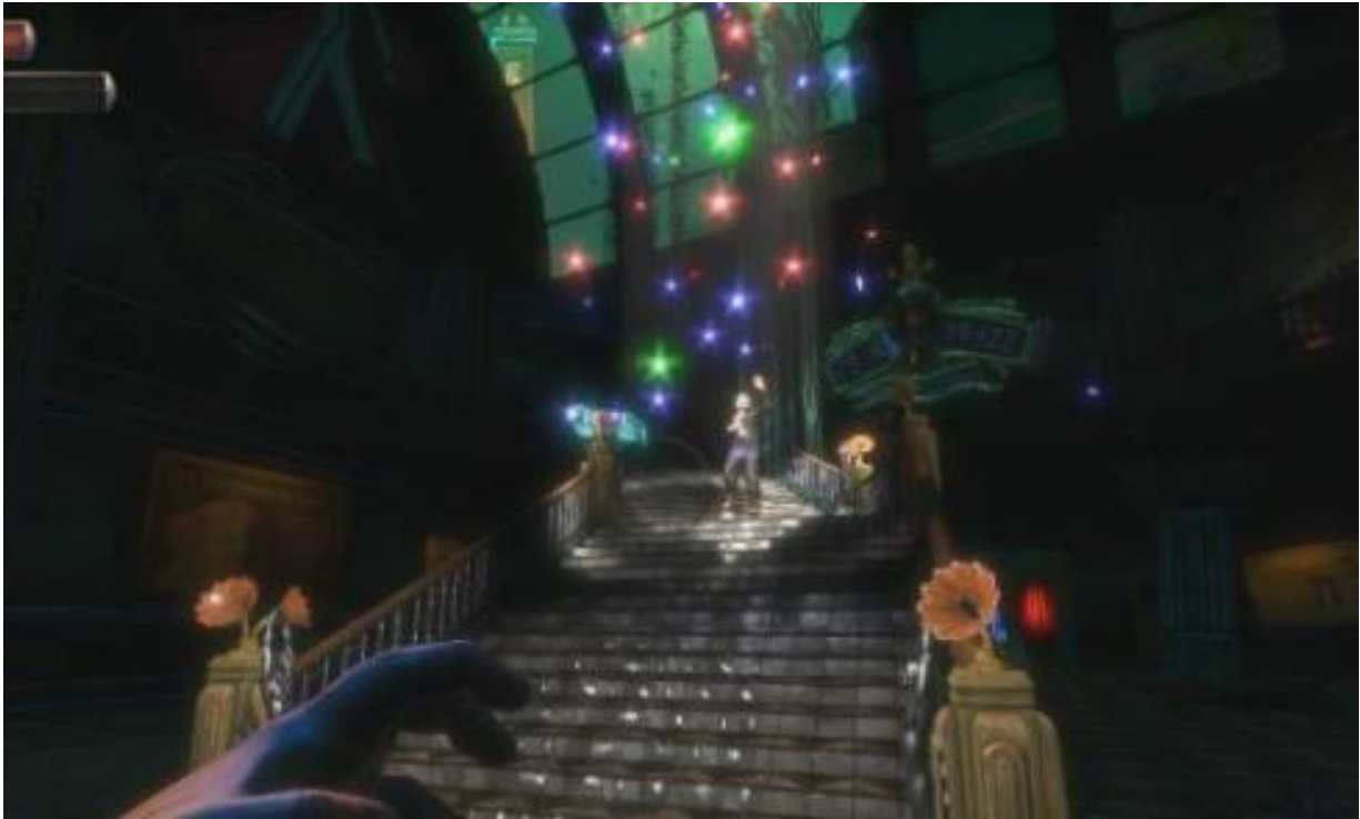
13. Teatralno spuštanje stepeništem Sandera Cohena, Irrational Games, BioShock Remastered , 2016

Možda najznamenitiji primjer ovakvog scenografskog osvjetljenja nalazimo na razini Fort Frolic kada igrač susreće ekscentričnog umjetnika Sandera Cohena. Na danoj razini svjetlo je postavljeno u službu Cohenova umjetničkog izraza – reflektori dramatično osvjetljavaju pozornice na kojima se nalaze Cohenovi umjetnički radovi, a tu je i osvjetljenje njegovih izvrnutih skulptura koje imitira muzejski fokus na umjetničko djelo. U istom kontekstu posebno se ističe gotovo filmska scena Cohenova pobjedničkog spuštanja središnjim stubištem atrija popraćen aplauzom (sl. 13). U tom trenutku svjetlo u dotada dobro osvijetljenom atriju postaje prigušeno, a reflektori i kamera usmjeravaju se na figuru i, kao u filmu, prate njeno usporeno spuštanje.