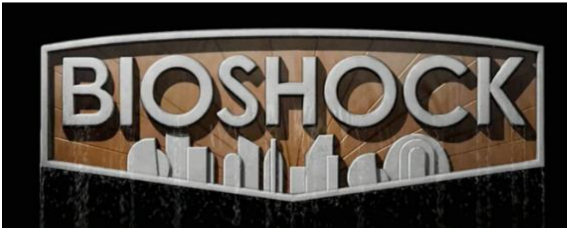
1. Logotip videoigre BioShock , Irrational Games, BioShock Remastered , 2016.

Videoigra koju ću obuhvatiti analizom jest prva igra iz serijala 3D igara BioShock (sl. 1). Riječ je o retrofuturističkom FPS-u s elementima RPG-a. Videoigru je razvio studio Irrational Games (znan kao 2K Boston od 2007. do 2009.) u razdoblju od 2002. do 2007. kada ju je objavila tvrtka 2K Games. Kako je već spomenuto, riječ je o videoigri koju mnogi smatraju prekretnicom u poimanju kreativnih i estetskih mogućnosti videoigara. BioShock je jedna od prvih iznimno komercijalnih AAA-igara koju je razvio veliki studij i koja je usmjerena širokoj publici popraćena iznimno pozitivnim recenzijama za inovativan gameplay , širenje mogućnosti vizualnog oblikovanja te kvalitetan, bogat i slojevit narativ usmjeren ozbiljnijoj publici. Time stoji kao paragon mainstream komercijalne industrije koji se izdigao izvan okvira šablonskih i stereotipnih igara te pokazao da se dubina i kvaliteta mogu postići bez obzira na komercijalni aspekt koji se još od Waltera Benjamina i Frankfurtske škole često shvaća kao depersonalizirajući faktor koji umanjuje smisleni i istinski umjetnički doživljaj. 32