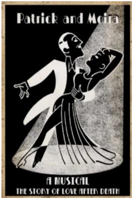
17. Plakat Patrick & Moira , https://bioshock.fandom.com/wiki/Patrick_and_Moira

Time (sl. 16). Reduktivan način oblikovanja oslanja se prvenstveno na liniju, a naglasak je na ženskoj figuri koja uživa u najnovijem sportskom trendu – golfu.