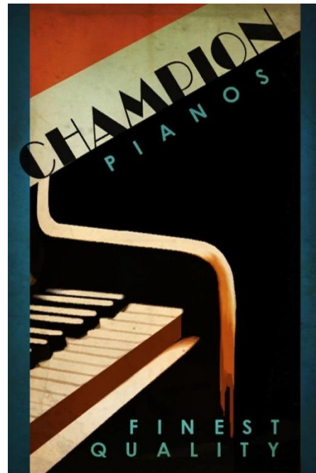
18. Plakat Champions Pianos https://bioshock.fandom.com/wiki/Champion_Pianos

Izuzev plakata, važnu ulogu u vizualnom oblikovanju prostora ima i neon koji se izrazito popularizira u međuratnom razdoblju i postaje nezaobilazna pojava modernih gradova. Njega u BioShocku susrećemo već pri samom zaronu i prvom susretu s gradom, a susrećemo ga posvuda i u samome gradu. (sl 2, 3 i 9). U tom smislu u Raptureu možemo prepoznati začetke onoga što Paul Virilo naziva ' overexposed city ', odnosno dinamičnog grada u kojemu nove i ubrzane tehnologije (poput sveprisutnih reklamnih plakata i zaslona, neonskog osvjetljenja i radija) počinju dominirati nad tradicionalnim poimanjem arhitekture kao oblikotvorne funkcije prostora. 96 Igrač je na pojedinim razinama videoigre, poput trgovačkog centra Fort Frolic kontinuirano okružen nebrojenim treperećim