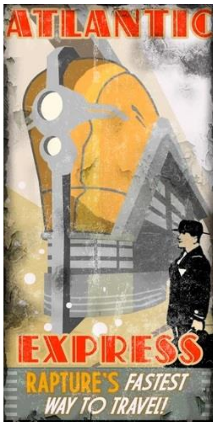
15. Plakat Atlantic Express , https://bioshock.fandom.com/wiki/Atlantic_Express_(Business)