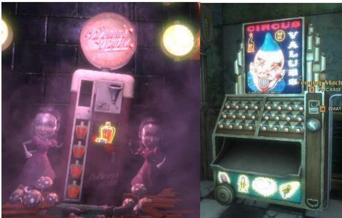
11. Primjer retro automata, Irrational Games, BioShock Remastered , 2016.