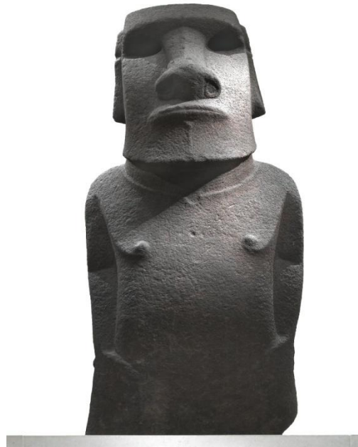
Slika 6: Hoa Hakananai'a

kao dar kraljice Viktorije. 73 Danas se stanovnici Uskršnjeg otoka nadaju povratku Hoa Hakananai'a naglašavajući njegovu kulturnu, ali i sentimentalnu važnost koju je guvernerka Uskršnjeg otoka, Tarita Alacrón Rapu, iskazala prilikom susreta sa predstavnicima British museuma rekavši: „Mi smo samo tijelo, vi Britanci imate našu dušu.” 74 O službenim zahtjevima i povratku skulpture ne postoje nikakve obavijesti na stranicama Muzeja.