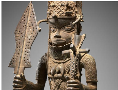
Slika 2: Jedna od beninskih skulptura koju je Muzej lijepih umjetnosti u Bostonu vratio Nigeriji