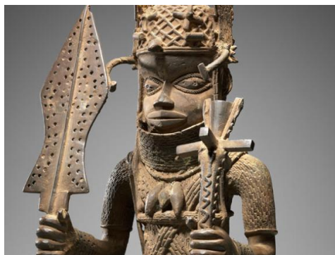
Slika 2: Jedna od beninskih skulptura koju je Muzej lijepih umjetnosti u Bostonu vratio Nigeriji

postala neovisna, zahtijeva vraćanje skulptura. 60 Ravnatelj British museum-a, Hartwig Fischer, je za New York Times izjavio kako je potrebno da se zbirke očuvaju u cjelini. 61 Na stranicama Muzeja ne postoje nikakve službene izjave vezane uz ovaj događaj. Nigerija je također tražila povrat od Muzeja lijepih umjetnosti u Bostonu koji je 2012. godine dobio dio tih skulptura kao dar od američkog kolekcionara Roberta Owena Lehmana. Muzej je pokrenuo istragu u kojoj su nađeni dokumenti koji potvrđuju da se radi o ilegalno izvezenim predmetima. Javnost je o svemu obaviještena na stranicama tog Muzeja te je 2014. godine objavljeno kako je osam predmeta vraćeno Nigeriji. U istoj objavi stoji kako u Muzeju postoji kustos za provjeru podrijetla predmeta te se navodi kako se Muzej drži najvećih profesionalnih standarda s obzirom na podrijetlo i vlasništvo. 62 Na stranicama Muzeja se nalazi i politika nabave i podrijetla u kojoj izričito piše kako Muzej neće nabavljati predmete koji su ukradeni ili ilegalno izvezeni iz zemlje podrijetla, kršeći zakone te iste zemlje. Također piše da će Muzej temeljito istražiti podrijetlo svih predmeta ponuđenih na dar što uključuje: prikupljanje svih informacija i pisane dokumentacije o povijesti vlasništva predmeta kao i dokumentacije o uvozu i izvozu, provođenje istraživanja o tome postoje li potvrde o vlasništvu te dokumentiranje svih napora istrage popunjavanjem upitnika o podrijetlu. 63