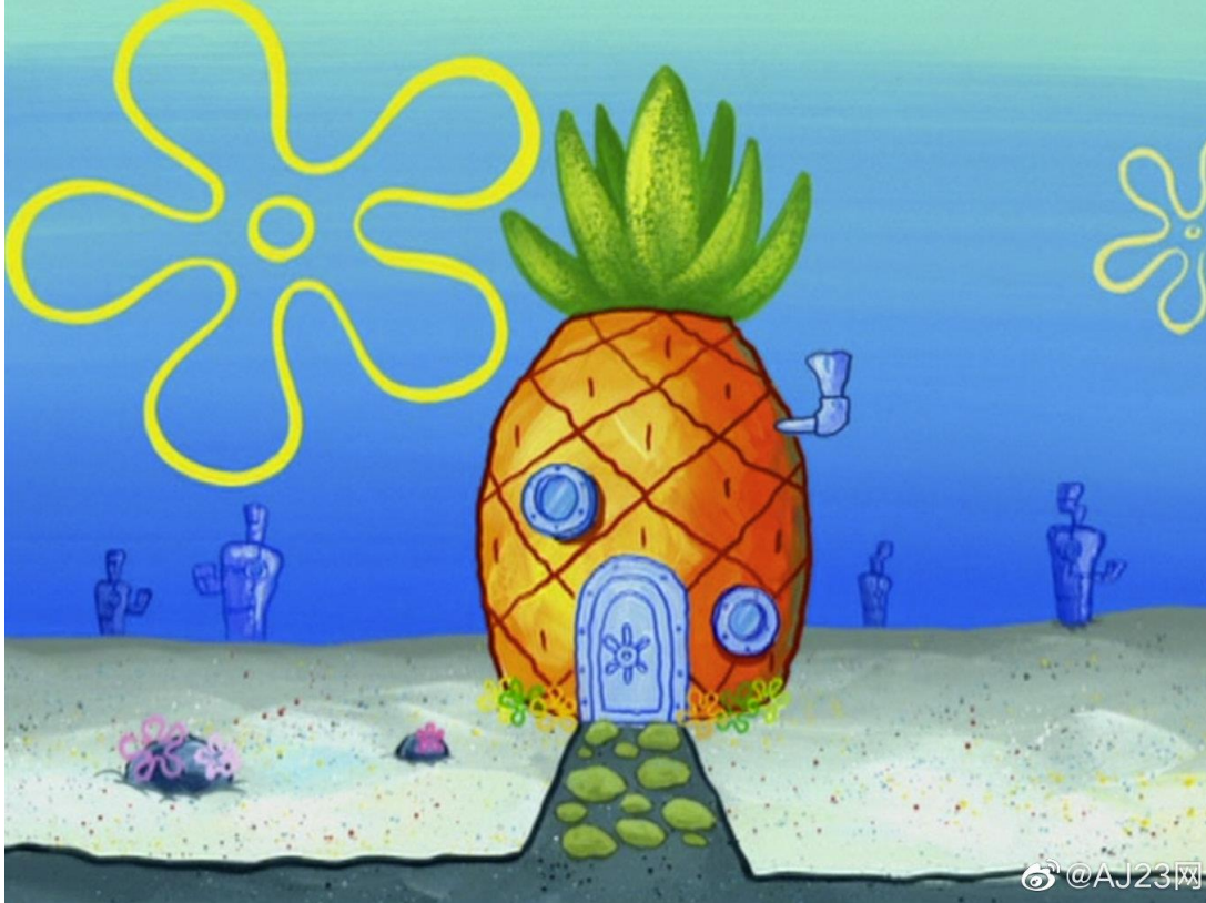
Anhang 2: Bild von SpongeBob