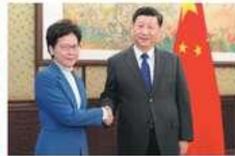
Xi praises Lam's courage, leadership