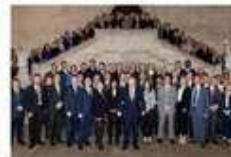
Johnson vows spee invest more

Teško je procijeniti koliko Kina plaća da New York Times, Wall Street Journal i najmanje 30 drugih novina objavljuju China Watch, ali prema jednom izvješću britanski Daily Telegraph dobiva više od devet milijuna dolara kako bi se mjesečno priložilo između četiri i osam stranica.