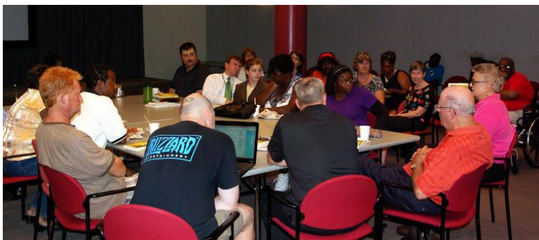
Slika 2 The Turning Pages Book Club