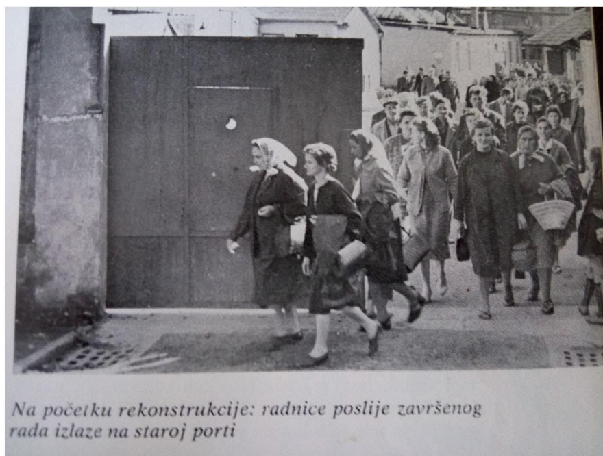
Fotografija „rijeka“ žena, radnica, nakon završenog rada (iz ur. I. Bratko „Međimurska trikotaža 1923. – 1973.“, „Zrinski“, Čakovec 1973. str. 7.)

“Zbog opće politike neinvestiranja u granične krajeve, kao i zbog neadekvatnog odnosa društva prema tekstilnoj industriji općenito - koja je, usput rečeno, na svojim leđima ponijela najveće breme poslijeratne izgradnje, industrijalizacije i elektrifikacije zemlje - u razdoblju od 1946. do 1956. godine nije bilo gotovo nikakvih investicijskih ulaganja u rekonstrukciju i modernizaciju ove tvornice” 19