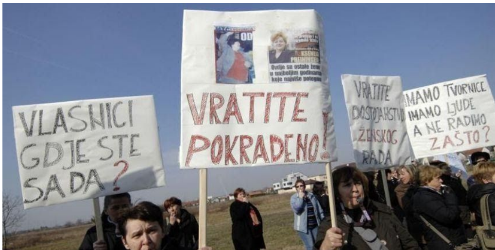
Slika 10. Prosvjed radnica zbog malverzacija u MTČ-u, 2009. godine, ispred tvornice