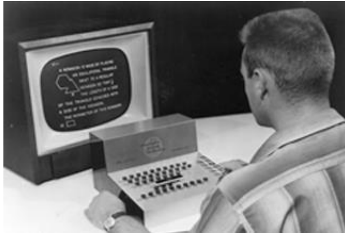
Slika 1: PLATO s prikazanim matematičkim problemom