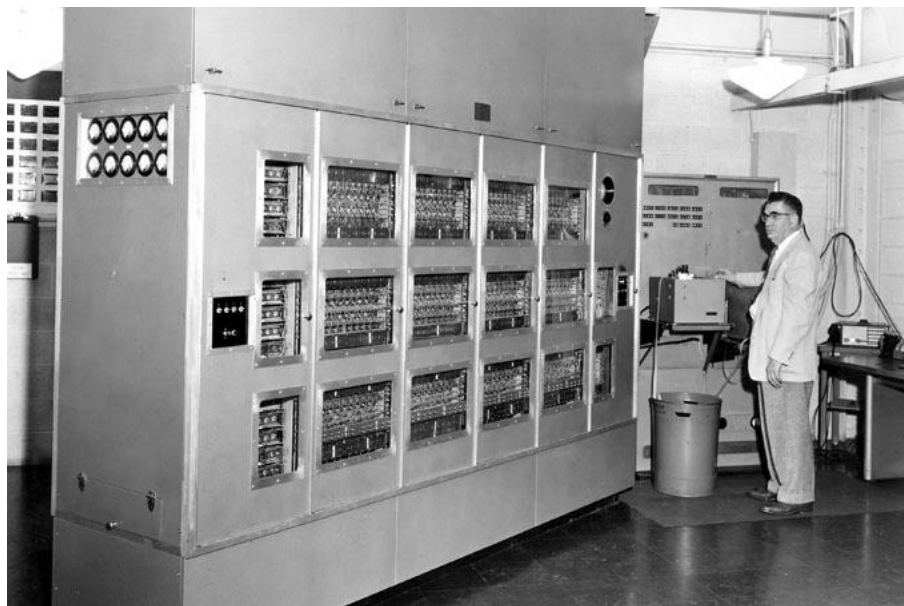
Slika 2: Model ILLIAC I iz 1952. godine