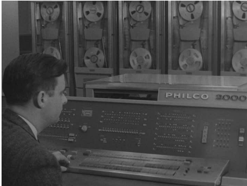
Slika 3: Philco 2000 (, 21.5.2019., url)