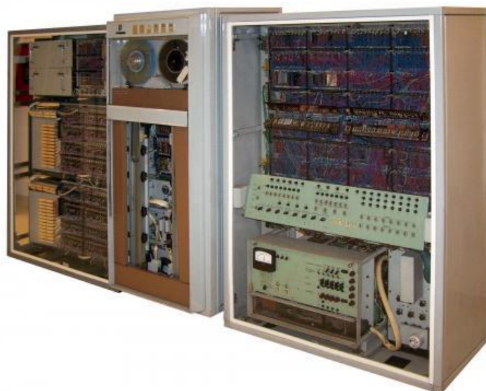
Slika 4: Minsk-32 (Informatika Történeti Kiállítás, 21.5.2019., url)