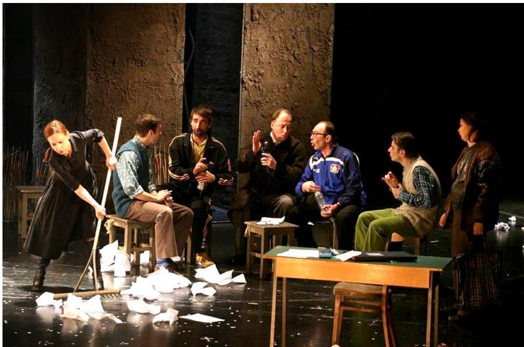
Slika 12 Matijina majka u crnini, susjedi