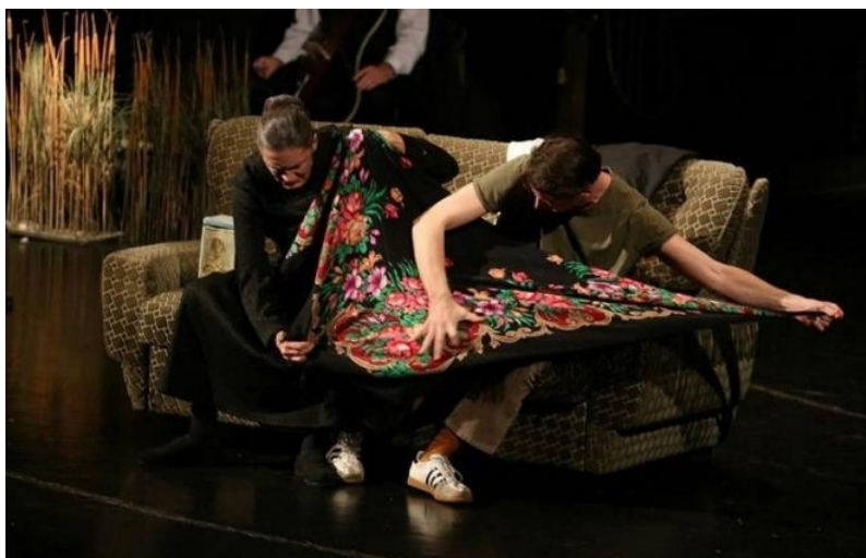
Slika 5 Dnevni boravak

Prostor je u predstavi maksimalno stiliziran, odnosno reduciran samo na najosnovnije elemente scenografije koji denotiraju/specificiraju konkretno mjesto radnje, ali bez namjere da ga i iluzijski realiziraju (odnosno da se proizvede potpuna iluzija realnog prostora). Tako je za stvaranje fiktivnog prostora dnevnog boravka dovoljan samo jedan kauč, za kuhinju drveni kuhinjski stol i stolci, za školsku učionicu mali drveni stolci i školska klupa koja služi kao učiteljičina katedra; mali drveni stolac na Matijinim leđima predstavlja školsku torbu, a plosnata blatna konstrukcija kokošinjac i pripadajuće dvorište s radionicom; omanja zelena podloga od umjetne trave na podu s desne strane pozornice denotira nogometni teren koji omeđuje niz nerazdvojivih drvenih stolaca na rasklapanje za navijače s jedne i druge strane terena.