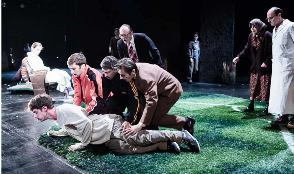
Slika 6 Nogometni teren