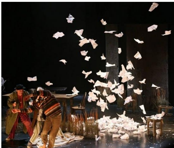
Slika 10 Papiri simboliziraju padanje snijega