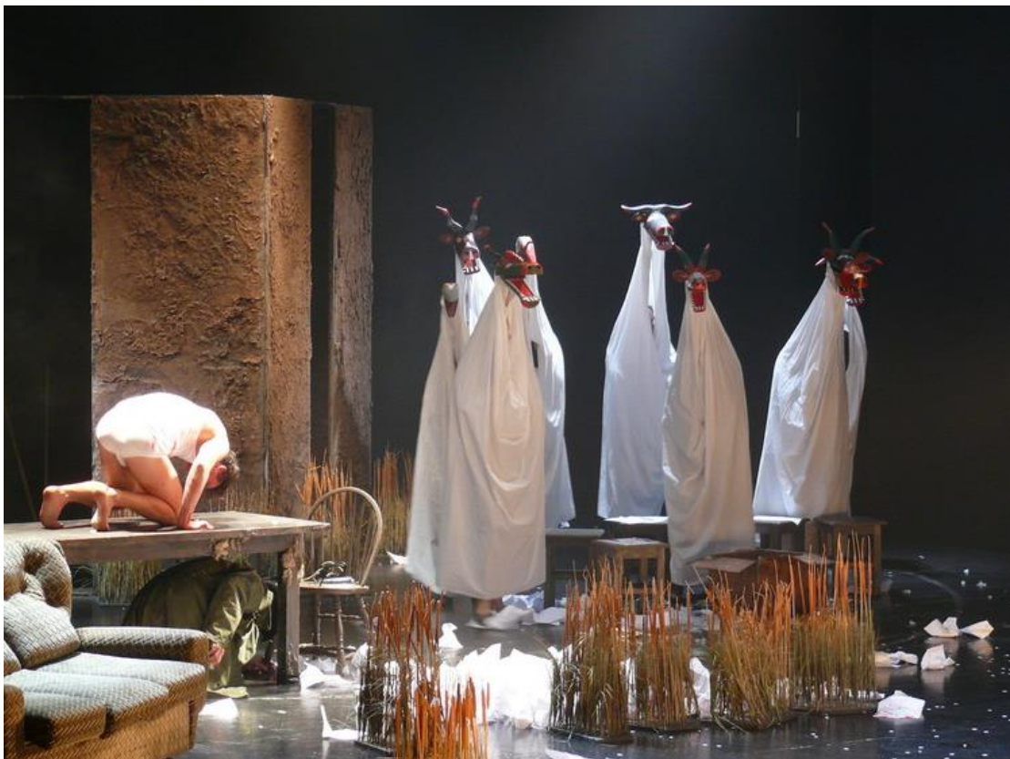
Slika 14 Pojava Svečara u šumi

Ipak, izdvaja se jedna scena u kojoj je ta atmosferskičnost u prvome planu. Osim narodnim međimurskim i pomalo mističnim melosom, postignuta je i elementima lutkarstva. To je trenutak kada Matija odlučuje otići u šumu k Svečarima i pronaći svoga oca; nalazimo je i u sižeju literarnog teksta. Dok Matija leži na stolu (kao u šumi na snijegu), samo u donjem rublju i krvavih tragova po čitavom tijelu, iz dubine scene ulazi osam „svečara“ (koliko je ukupno i žrtava samoubojstva!), odnosno drvene životinjske maske na visokim štapovima (nalik na narodne fašničke maske).