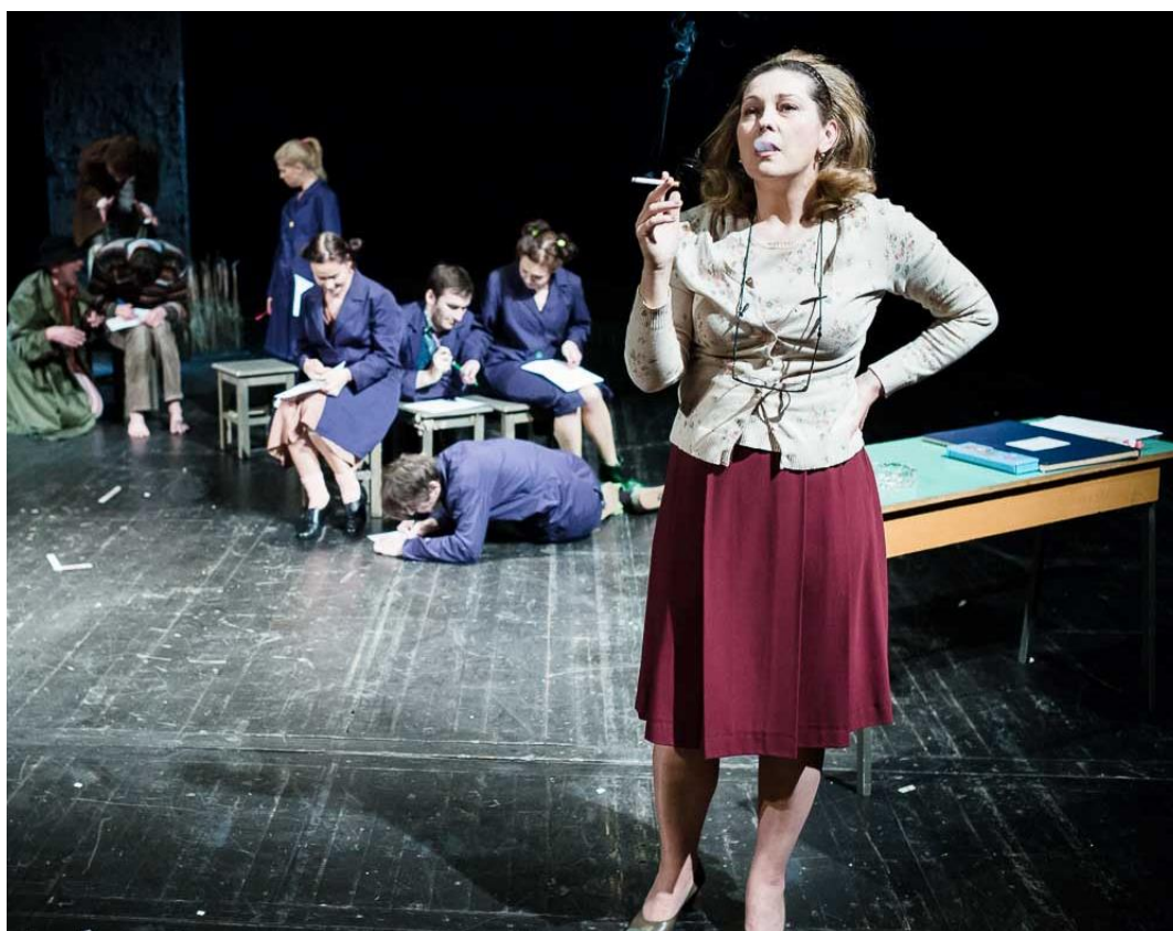
Slika 13 Prizor iz škole

U romanu je sociokulturna slika vremena s kraja 80-ih i početka 90-ih naznačena usputnim detaljima, poput spominjanja televizijskog kviza Brojke i slova , popularne glazbe tog vremena