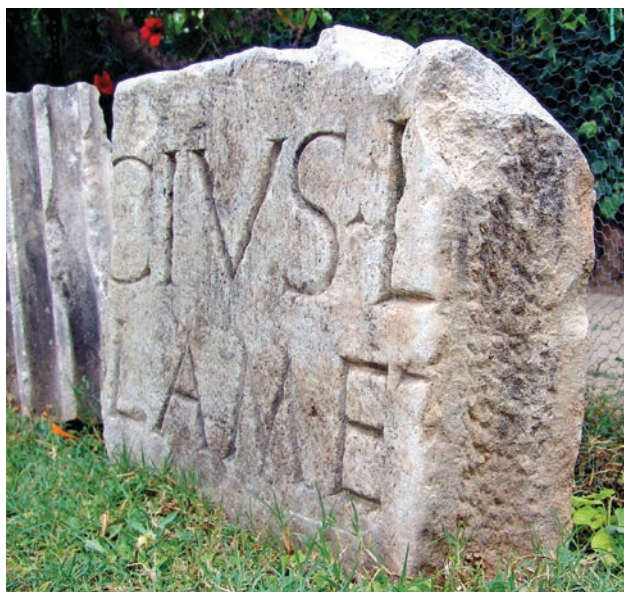
Slika 3a Bočna strana ulomka s natpisom (MM)