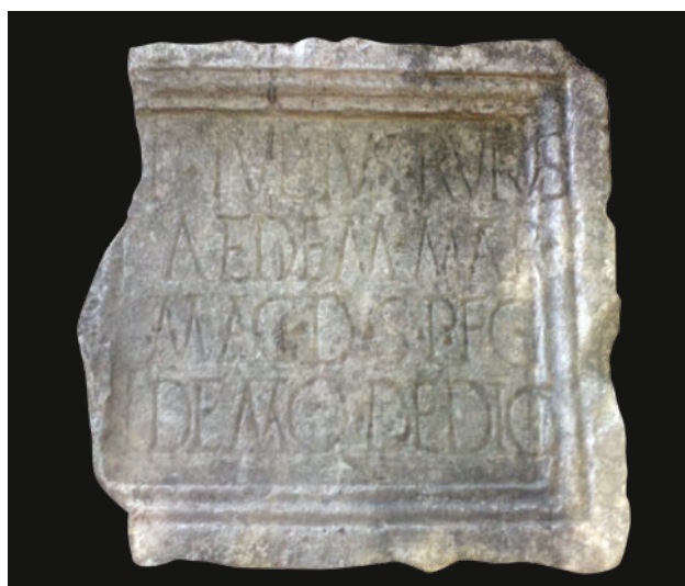
Slika 4 Ploča s natpisom Publija Julija Rufa (IVB)