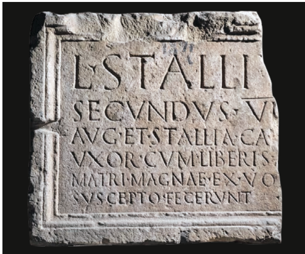
Slika 8 Ulomak ploče s natpisom Lucija Stalija Sekunda (OH)