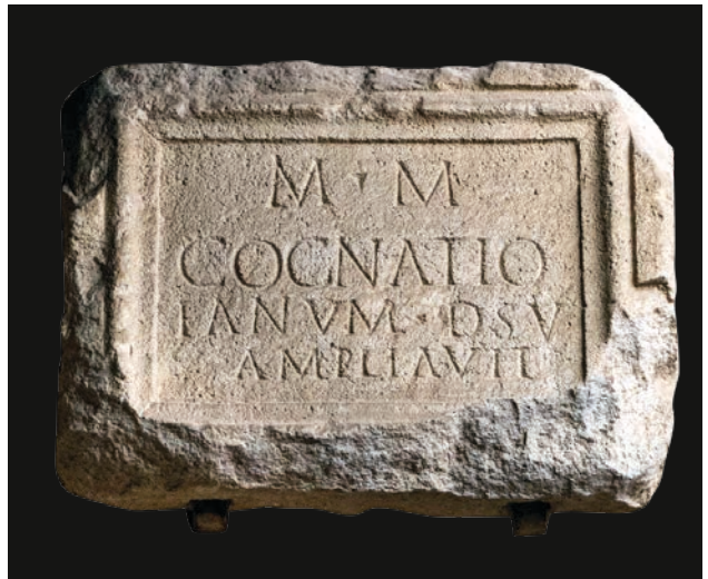
Slika 9 Ulomak ploče s kognacijskim natpisom (OH)

Kognacija je proširila svetište Velike Majke prema svom zavjetu.