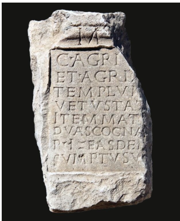
Slika 6 Ulomak ploče s natpisom Agrija (TS)