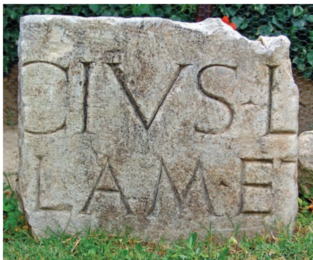
Slika 3 Ulomak zida s natpisom koji spominje celu (MM)