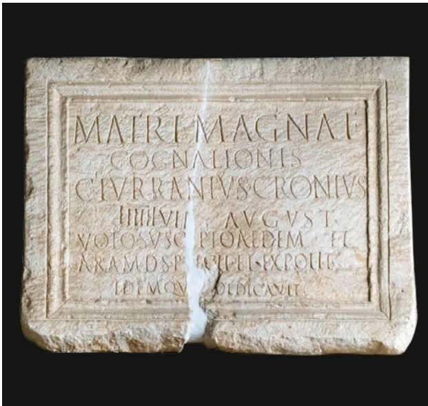
Slika 10 Ploča s natpisom Gaja Turanija Kronija (OH)