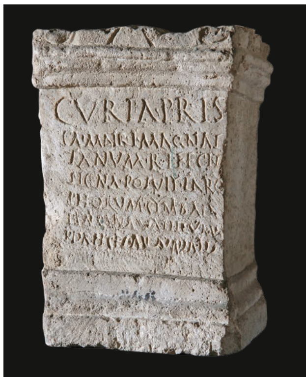
Slika 7 Žrtvenik s natpisom Kurije Priske (TS)