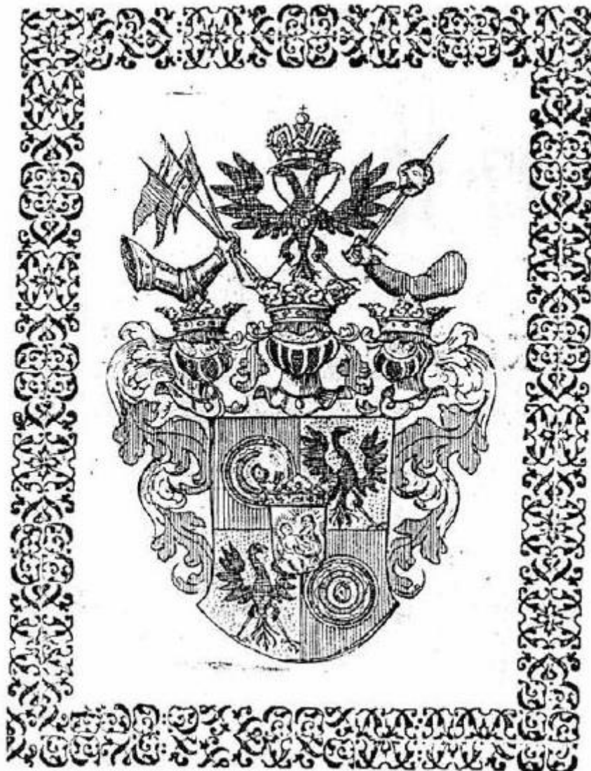
Slika 2. Grb obitelji Makar u djelu Oživljena Hrvatska 191