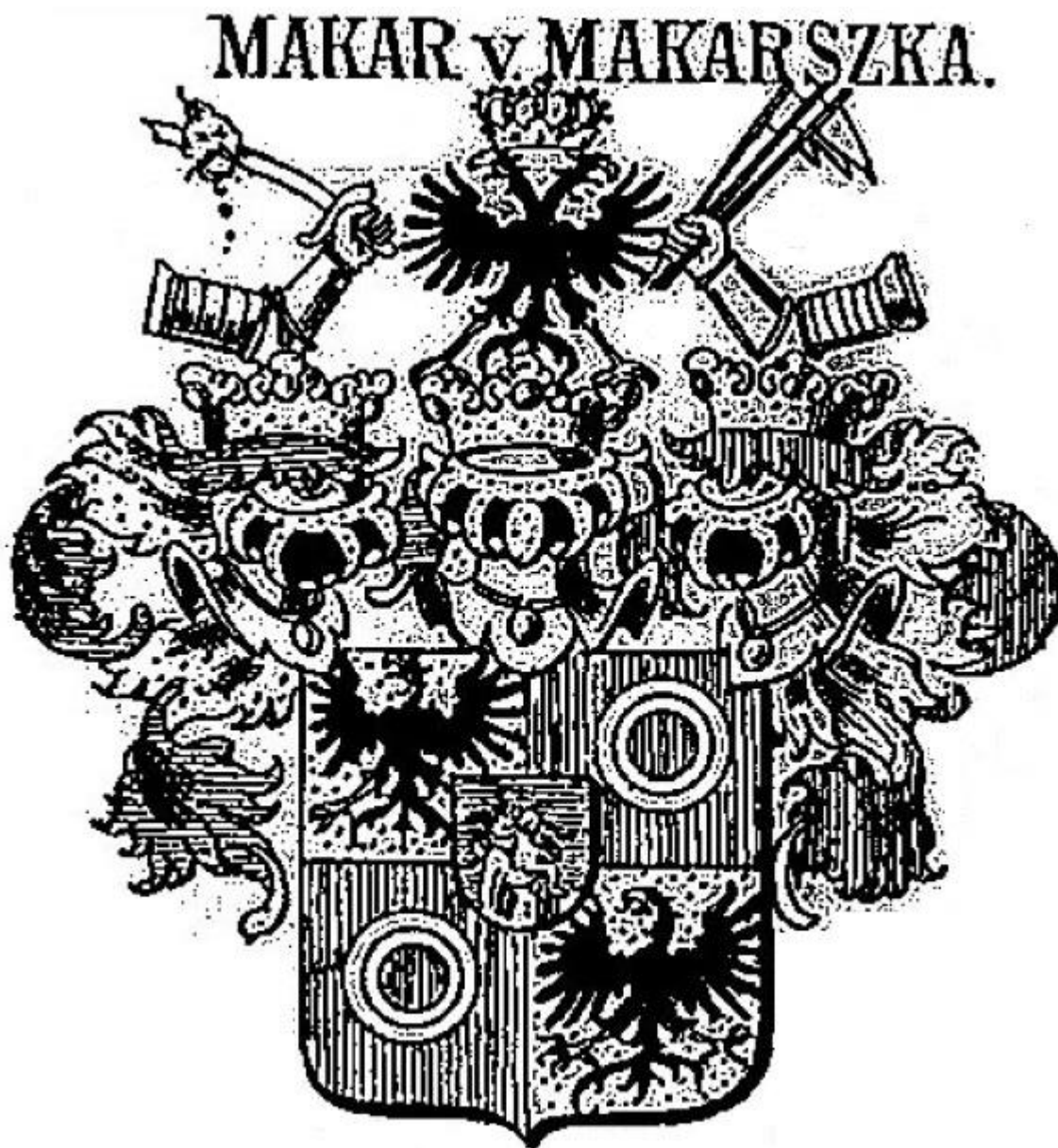
Slika 1. Grb obitelji Makar u djelu Der Adel von Kroatien und Slavonien 190